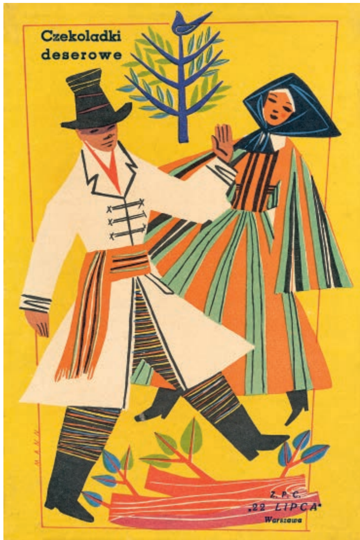
Opakowanie czekoladek deserowych, 1958, 25 × 17 cm / Box of chocolate confectionery, 1958, 25 × 17 cm

Grafika użytkowa, malarstwo ścienne, oprawa plastyczna wnętrz, wydawnictwa – tymi dyscyplinami Kazimierz Mann zdefiniował swoją twórczość w ankietach Związku Polskich Artystów Plastyków, deklarując chęć udziału w dwóch ekspozycjach z cyklu Polskie Dzieło Plastyczne , organizowanych z okazji XV-lecia PRL w Centralnym Biurze Wystaw Artystycznych w Warszawie: wystawie książki i ilustracji (od 3 lutego do 15 marca 1962 roku) oraz wystawie grafiki reklamowej (od 16 kwietnia do 3 czerwca 1962 roku) 1 . Była to bardzo trafna autoprezentacja, choć we wcześniejszej twórczości Kazimierza Manna nie brakowało prac malarskich i rysunkowych. To jednak właśnie bardziej użytkowe dziedziny artystyczne, mogące masowo oddziaływać na społeczeństwo, były bliskie artyście już od lat trzydziestych XX wieku. Projektując pocztówki, okładki czasopism, plakaty, prospekty reklamowe czy dekoracje plastyczne przestrzeni publicznych, wpisywał się w figurę nowoczesnego twórcy, który mógł realnie kształtować gusty i preferencje estetyczne szerokiej publiczności. Artysty, którego sztuka była obecna w codziennym (u)życiu.