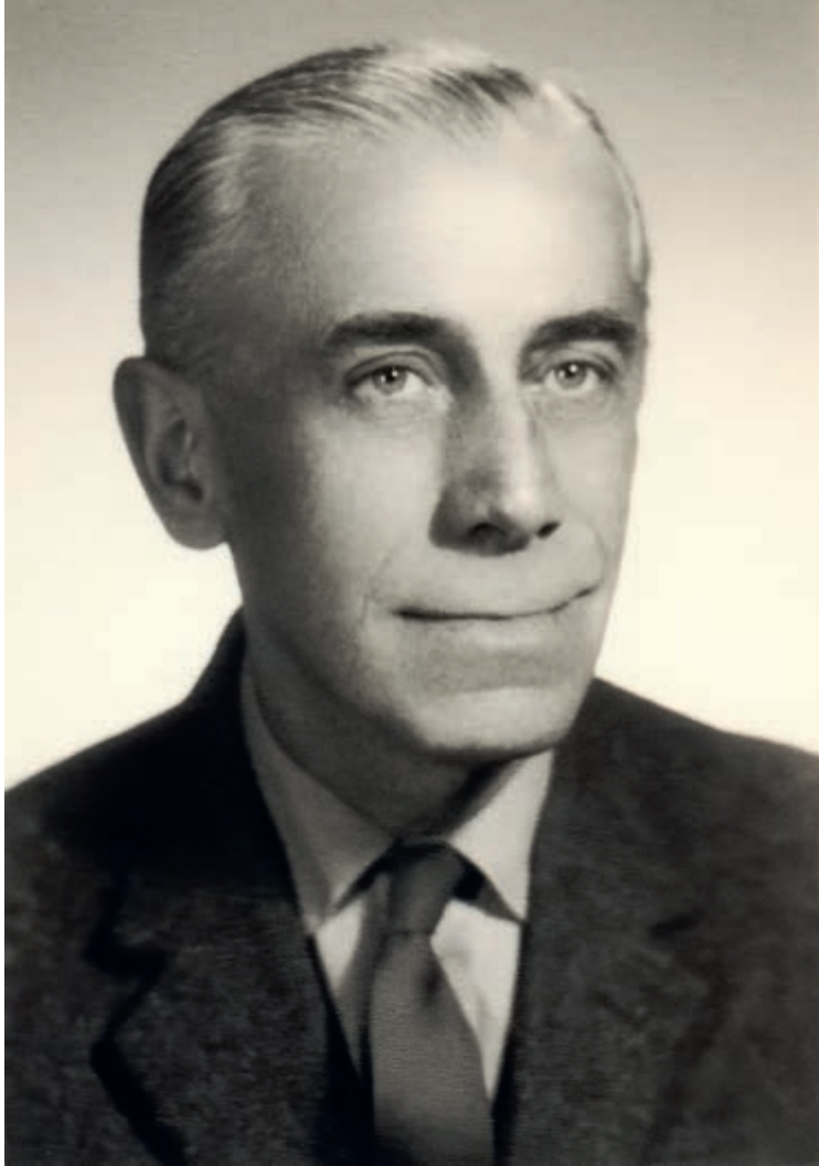
Kazimierz Mann, 1970