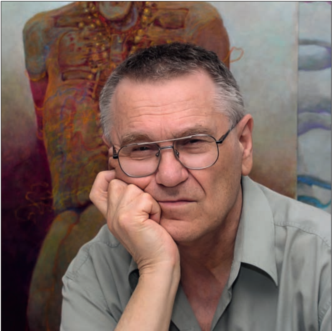
Zdzisław Beksiński Warszawa/Warsaw, 2003