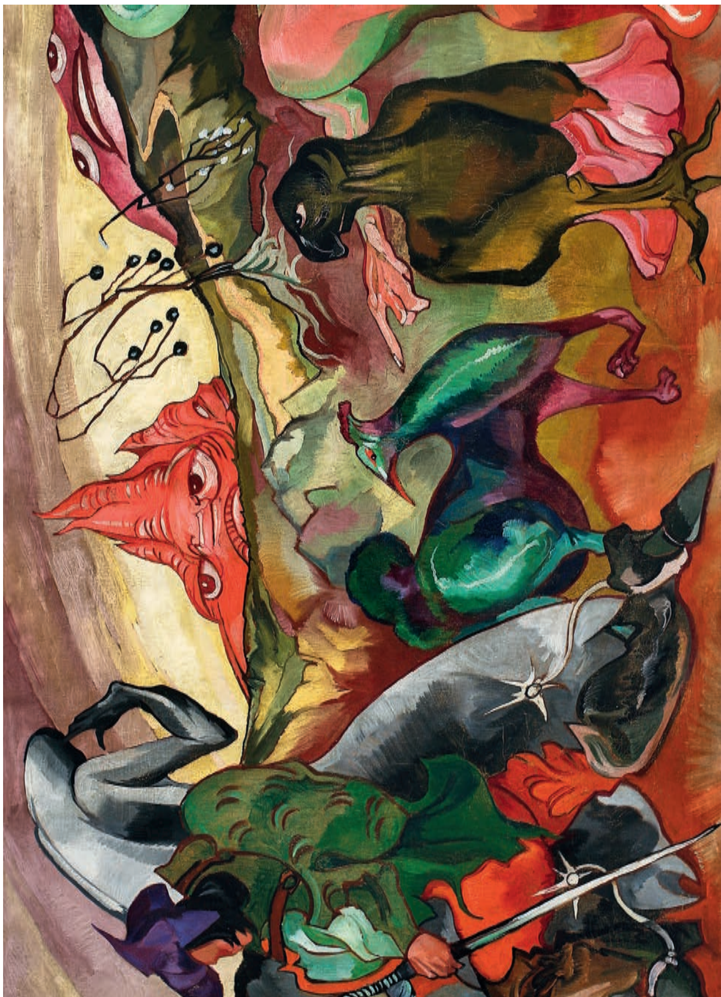
Bajka – fantazja, fragment, 1921–1922, olej, 74,5 × 150 cm Fantasy – Fairy Tale, fragment, 1921–1922, oil, 74.5 × 150 cm