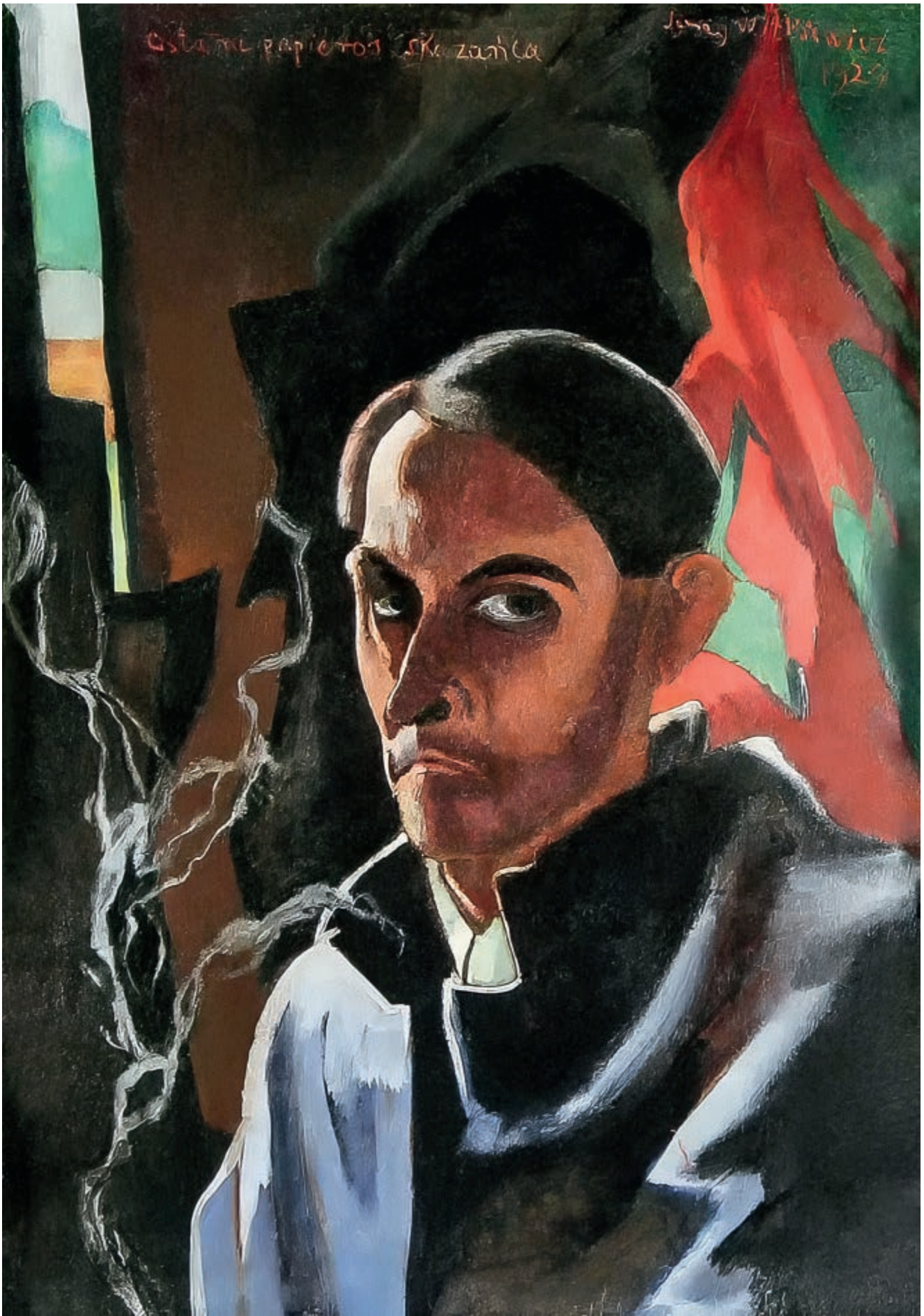
Autoportret – ostatni papieros skazańca, 1924, olej, 72 × 51 cm Self-Portrait – Convict's Last Cigarette, 1924, oil, 72 × 51 cm