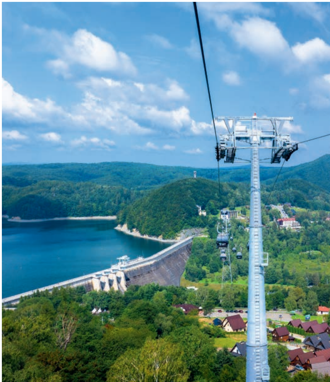
Kolej gondolowa w Solinie Solina Cable Car