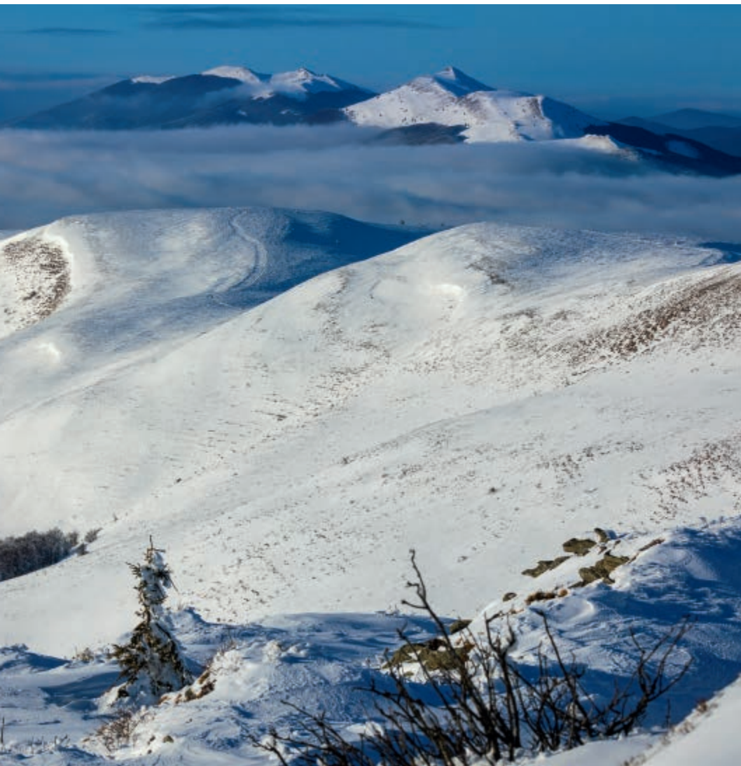
Szeroki Wierch i Poloniny zimą – widok z Tarnicy Szeroki Wierch and the Poloninas in winter – view from Tarnica