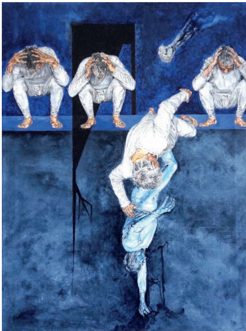
Ciała kuczające 2016 olej na płótnie 80 × 60 cm