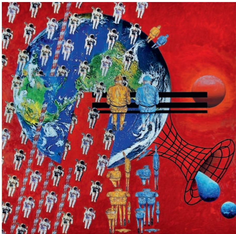
Circum mundi 2023 kolaż, olej na płótnie 100 × 100 cm