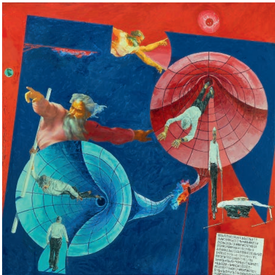
ku Michałowi A. 2024 kolaż, olej na płótnie 100 × 100 cm