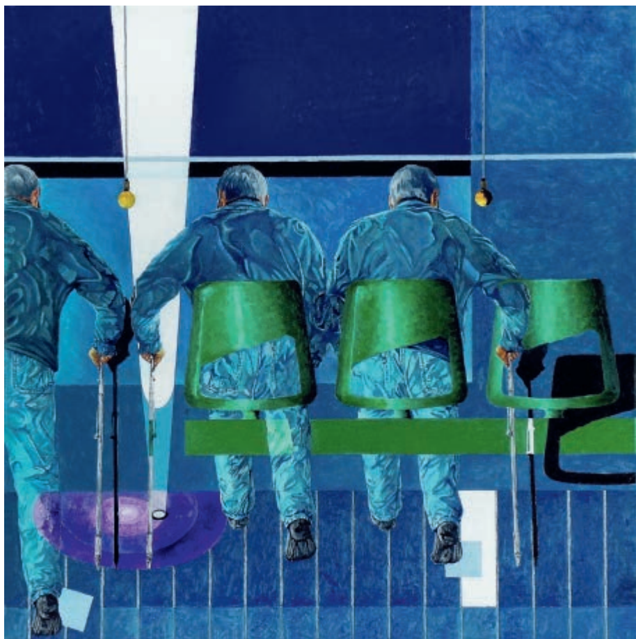
Siedzenia zielone 2021 olej na płótnie 80 × 80 cm