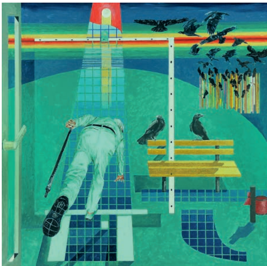
Okno 3 2024 olej na płótnie 100 × 100 cm