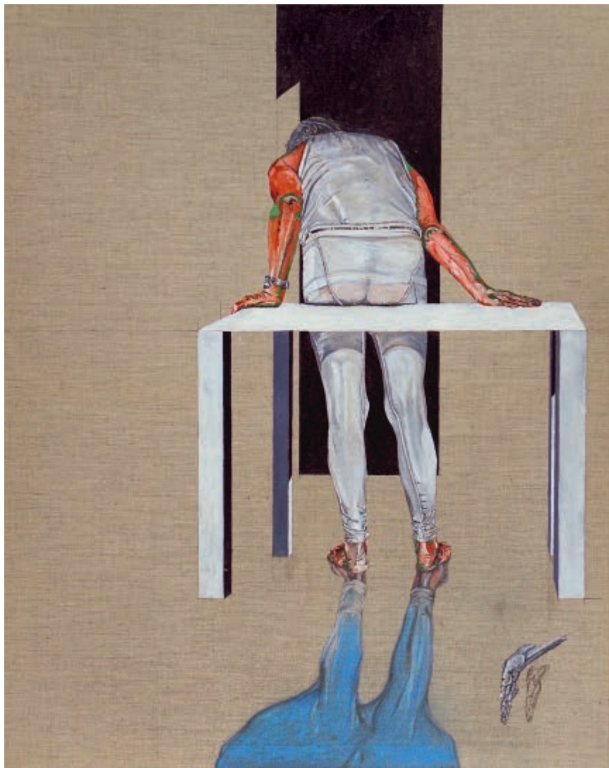
Ciało od pleców 2018 olej na lnie 100 × 80 cm