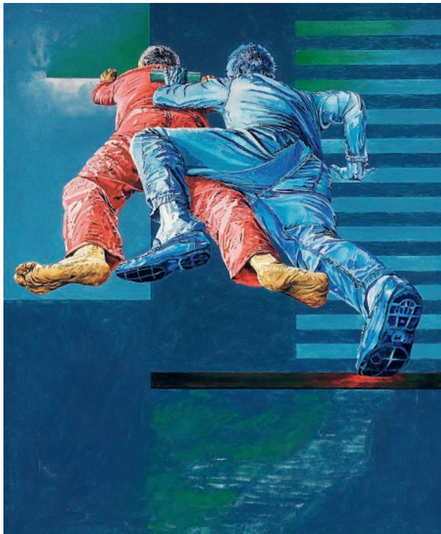
Ruch 2 2015 olej na płótnie 65 × 54 cm