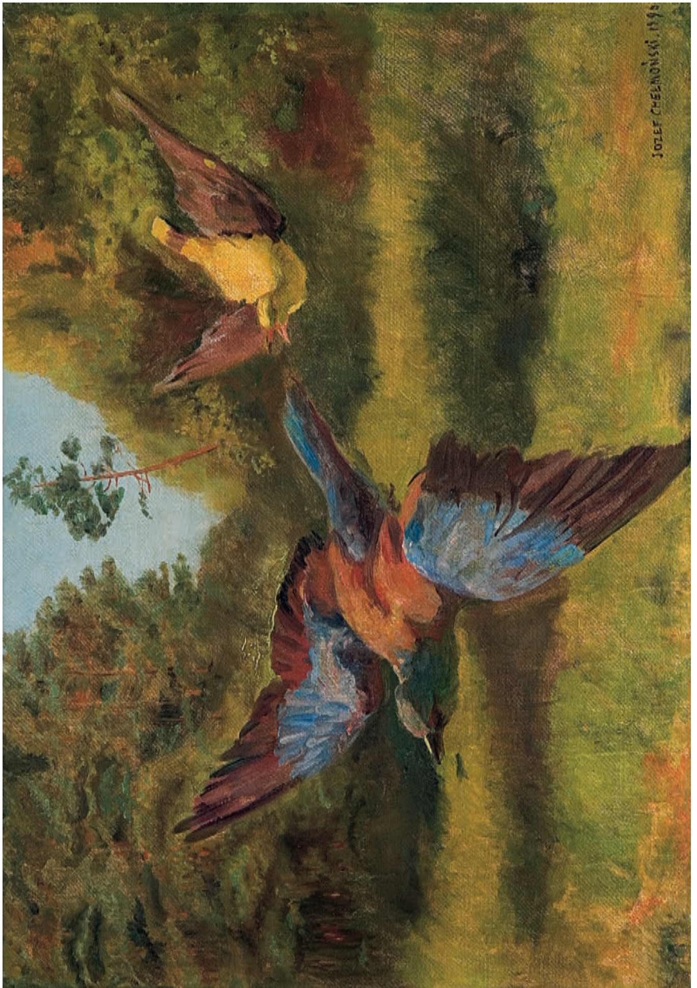
Wilga i kraska , 1896, olej na płótnie, 40 × 57,5 cm

Golden Oriole and European Roller , 1896, oil on canvas, 40 × 57.5 cm