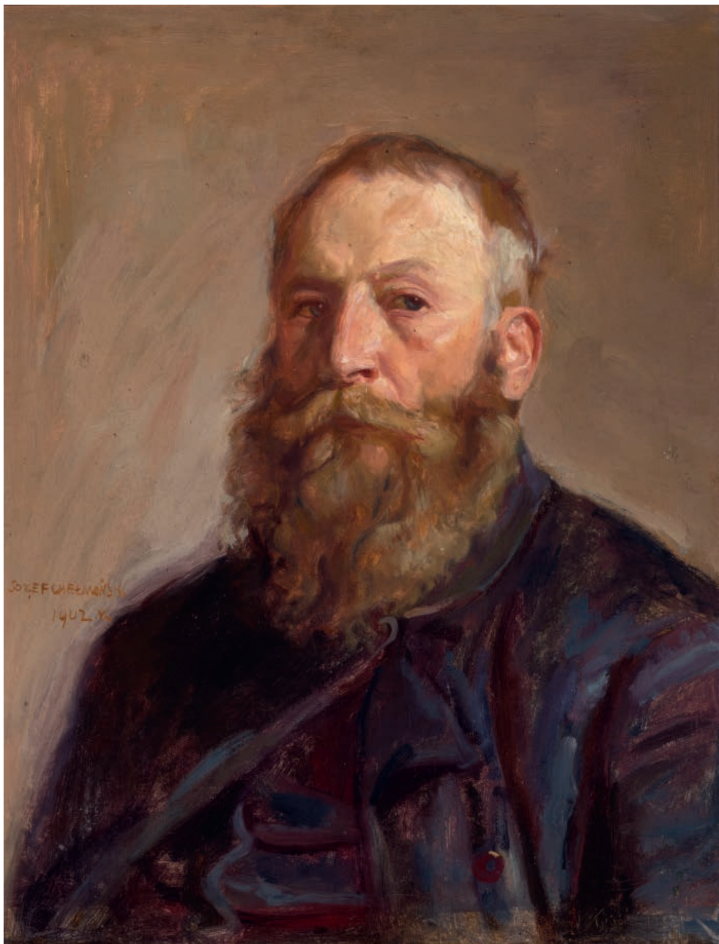
Autoportret, 1902, olej na płótnie, 51 × 40 cm Self-Portrait, 1902, oil on canvas, 51 × 40 cm