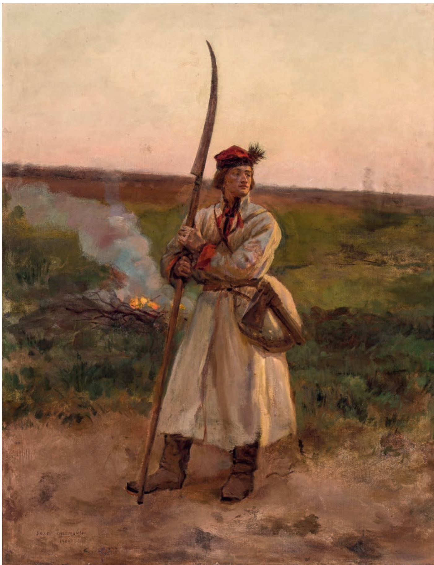
Kosynier , 1906, olej na płótnie, 87,5 × 67,6 cm Scytheman , 1906, oil on canvas, 87.5 × 67.6 cm