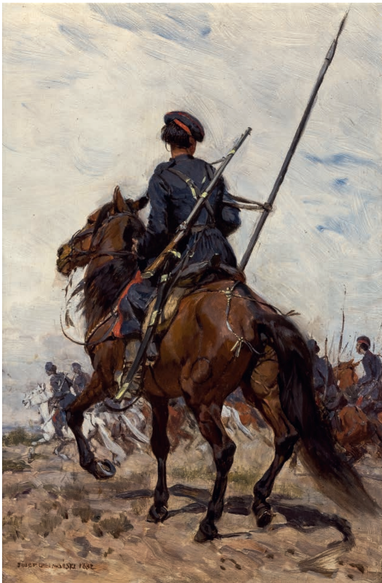
Kozak , 1882, olej na desce, 25,7 × 16,5 cm A Cossack, 1882, oil on board, 25.7 × 16.5 cm