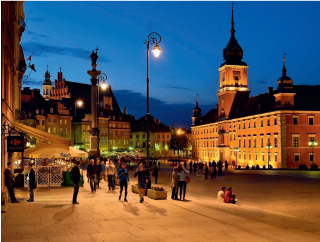
Plac Zamkowy z Zamkiem Królewskim i Kolumną Zygmunta

Zamkowy Square with the Royal Castle and the Column of King Sigismund III Vasa