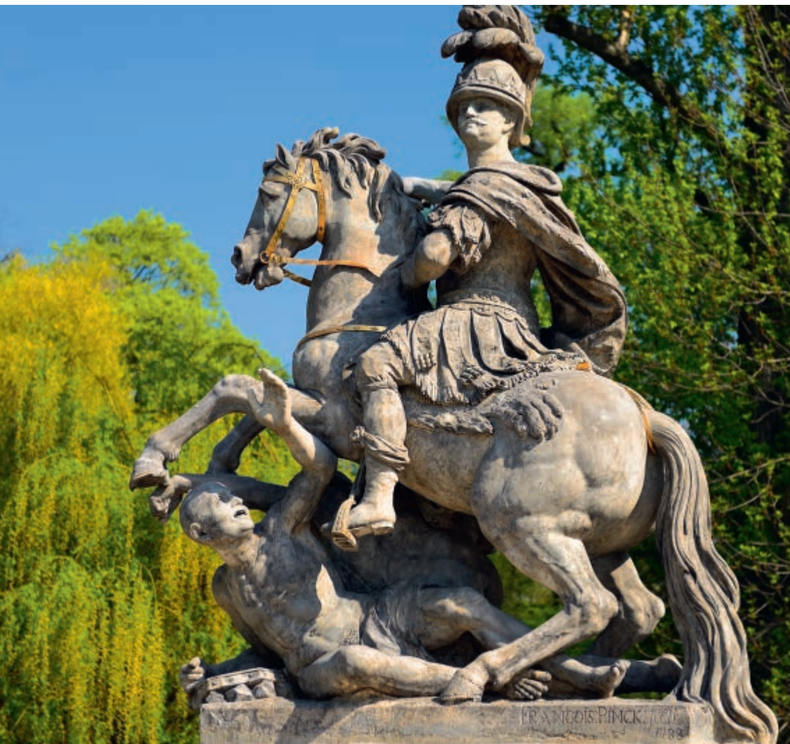
Pomnik króla Jana III Sobieskiego w Łazienkach Królewskich

Statue of King John III Sobieski in the Royal Baths Park