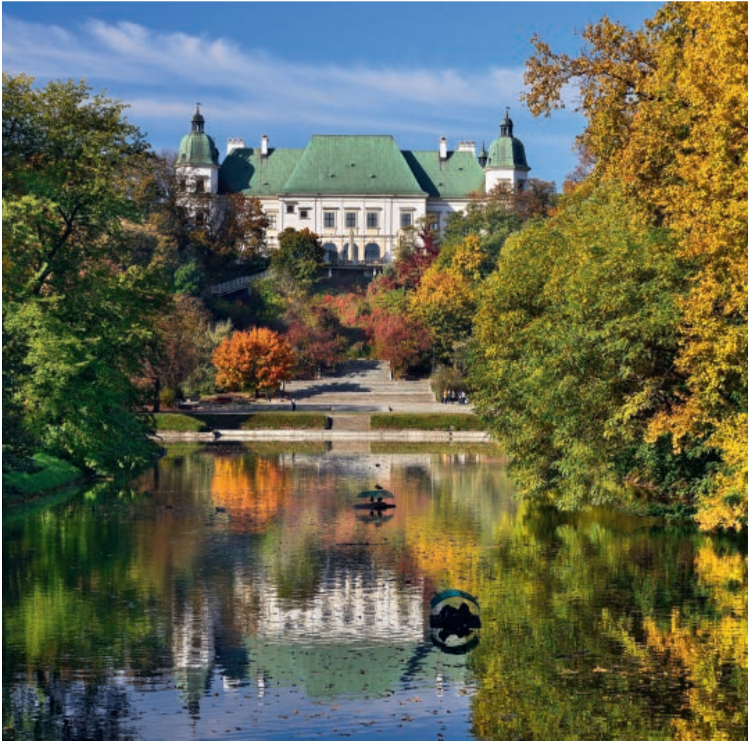
Zamek Ujazdowski w Śródmieściu – widok od strony parku Agrykola