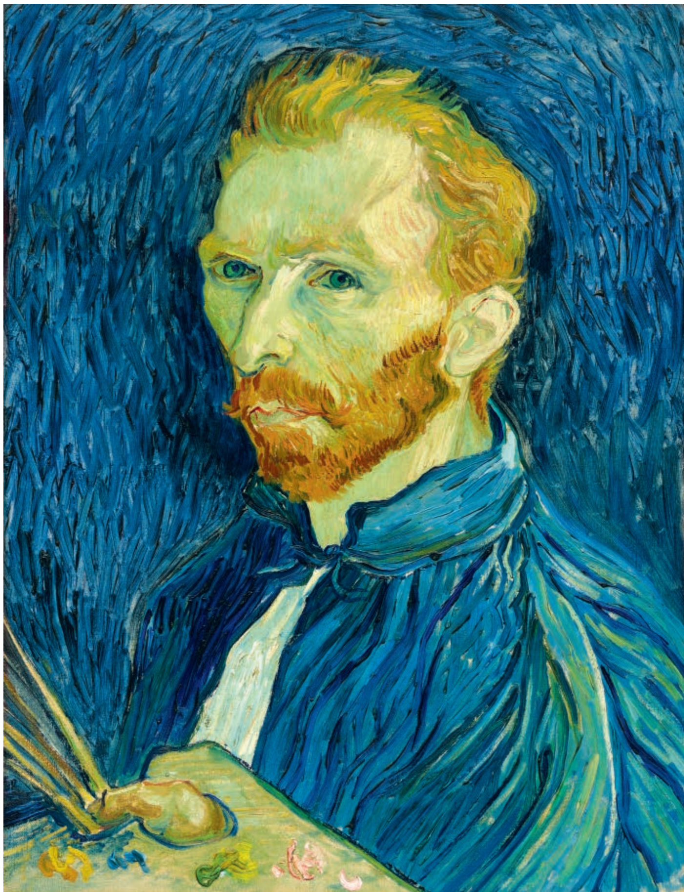
Autoportret, 1889, olej na płótnie, 57,8 × 44,5 cm Self-Portrait, 1889, oil on canvas, 57.8 × 44.5 cm