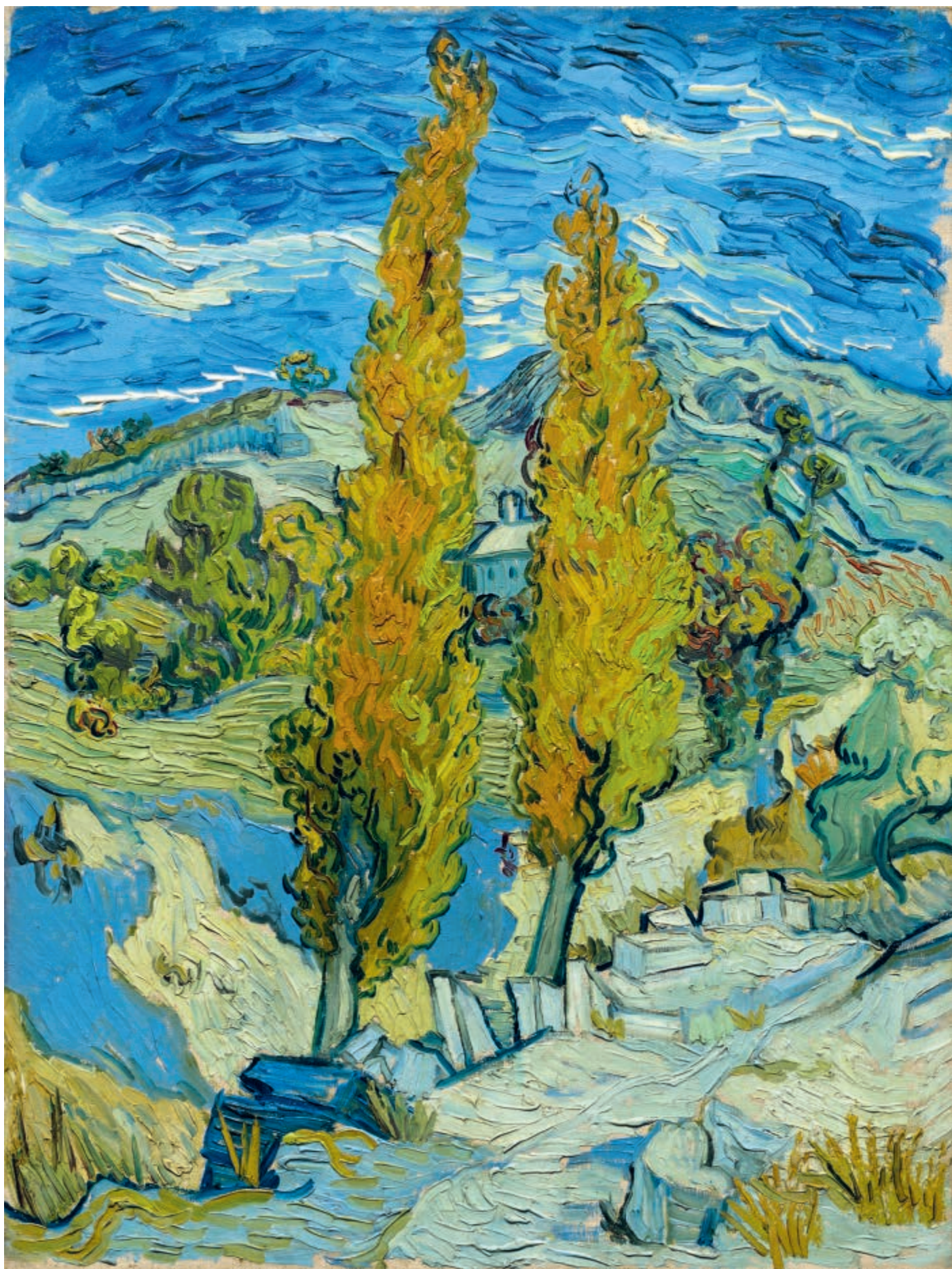
Dwie topole w Alpilles w pobliżu Saint-Rémy, 1889, olej na płótnie, 61,6 × 45,7 cm Two Poplars in the Alpilles near Saint-Rémy, 1889, oil on canvas, 61.6 × 45.7 cm