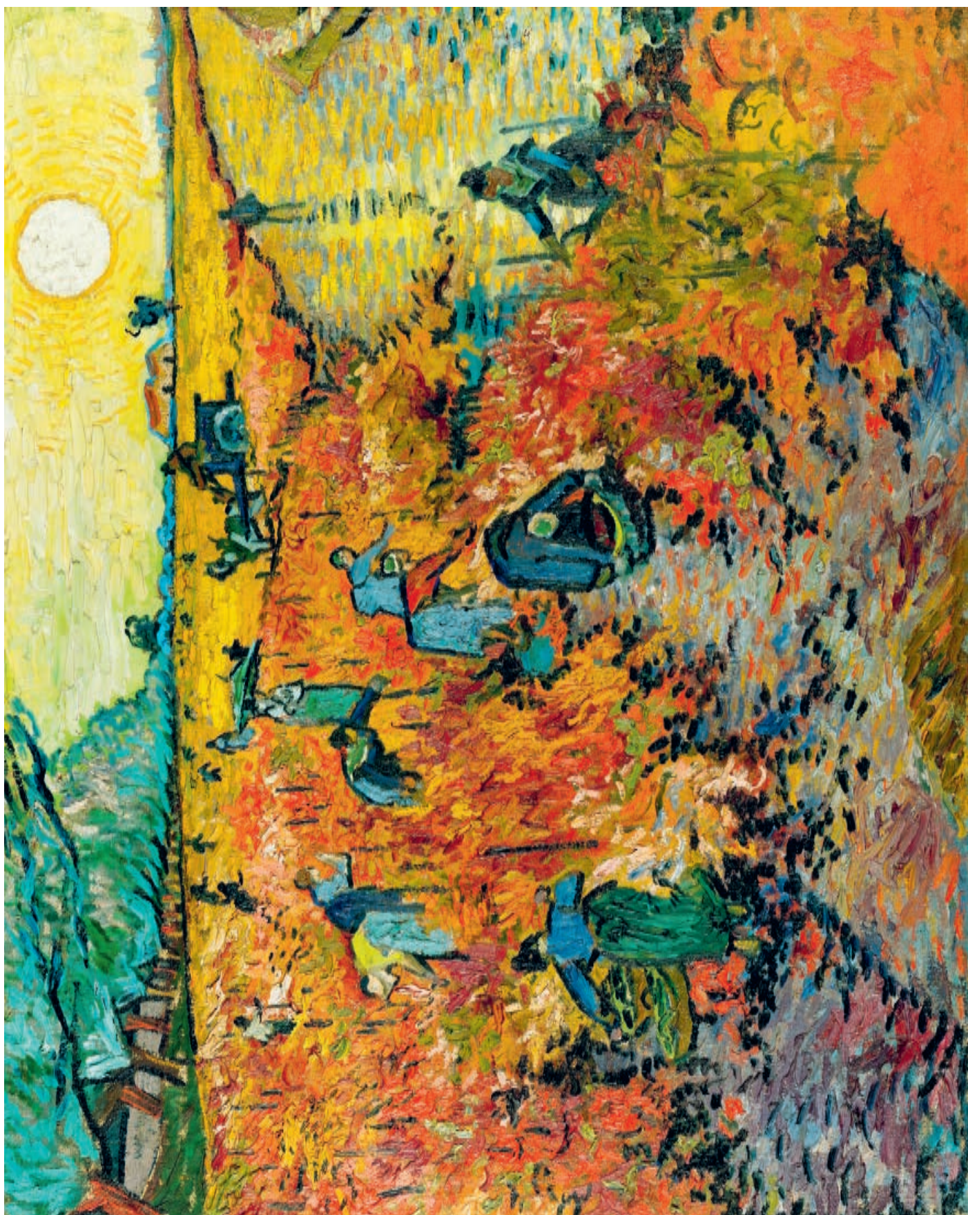
Czerwona winnica, 1888, olej na płótnie, 75 × 93 cm The Red Vineyard, 1888, oil on canvas, 75 × 93 cm