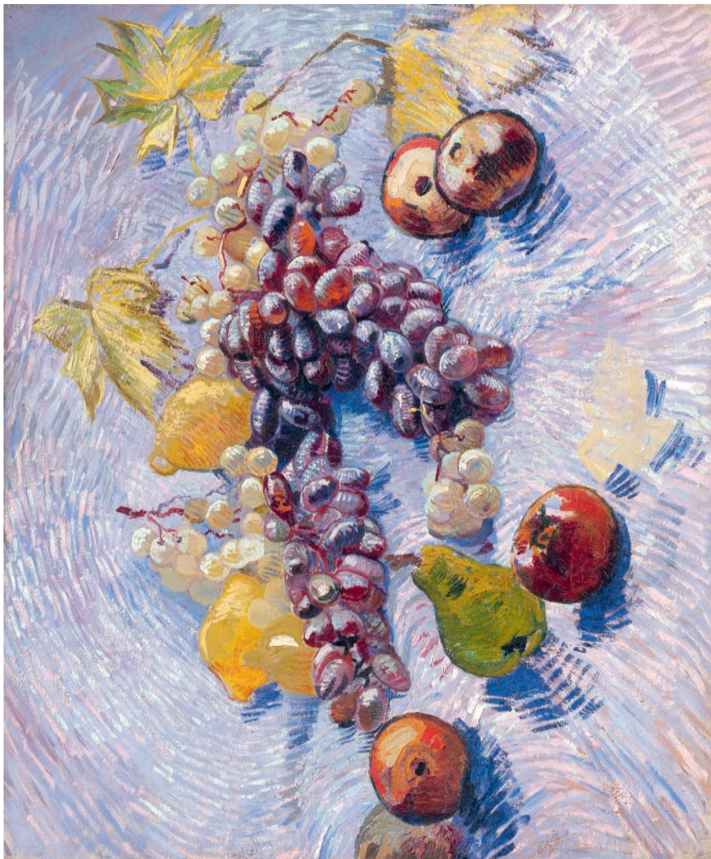
Winogrona, cytryny, gruszki i jabłka, 1887, olej na płótnie, 46,5 × 55,2 cm Still Life with Apples, Pears, Lemons and Grapes, 1887, oil on canvas, 46.5 × 55.2 cm