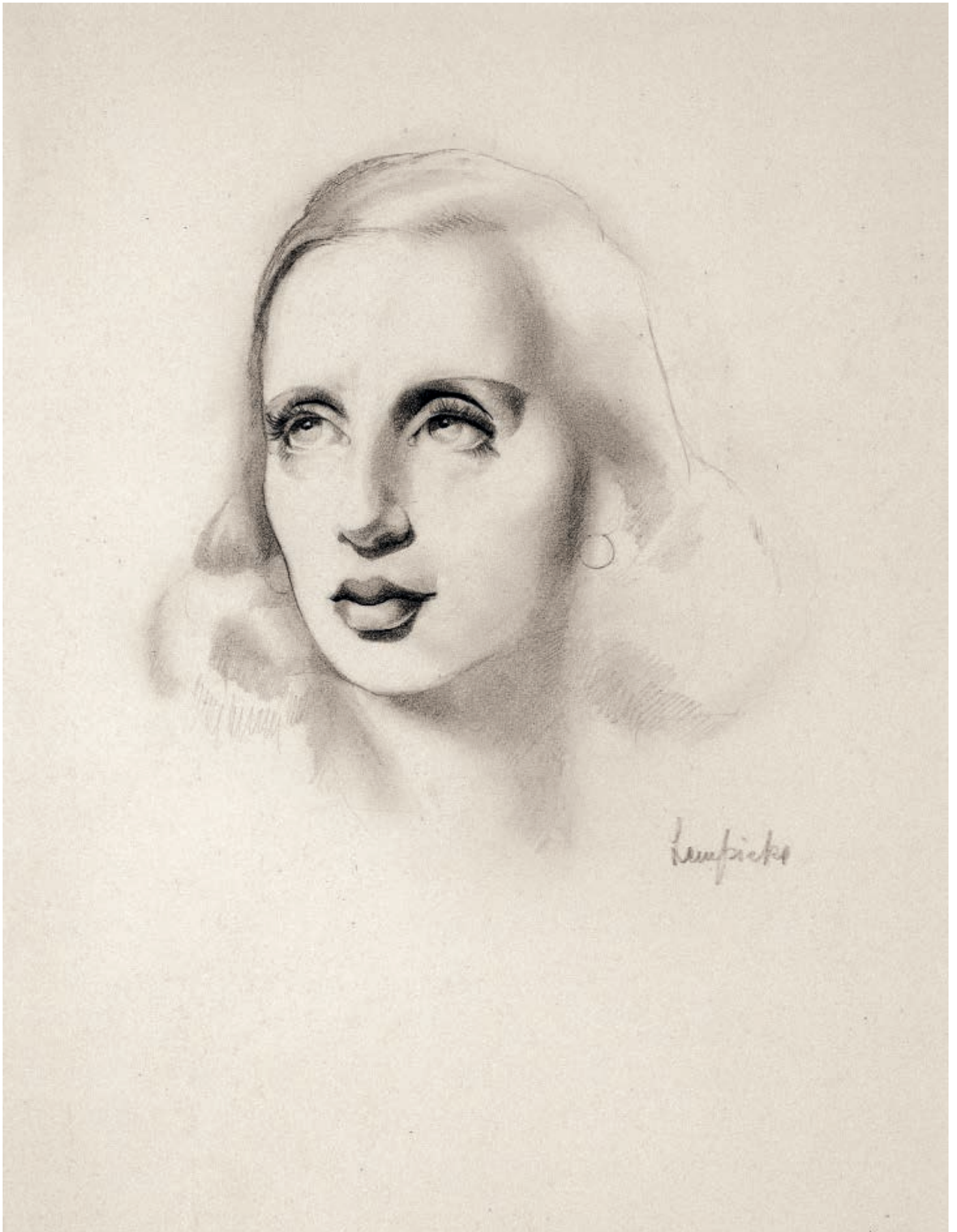
30. Autoportret (Autoportrait) , około 1939, ołówek na papierze, 32 × 23,5 cm