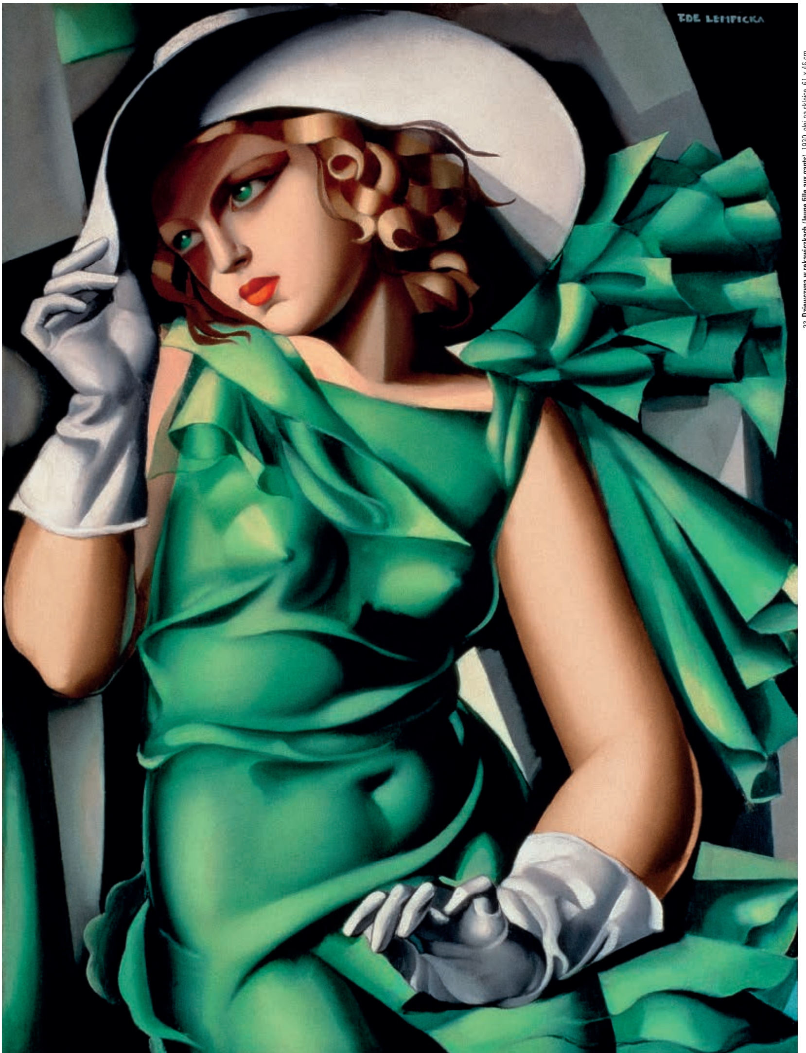
23. Dziewczyna w rękawiczkach (Jaune fille aux gants), 1930, olej na szkłce, 61 x 46 cm