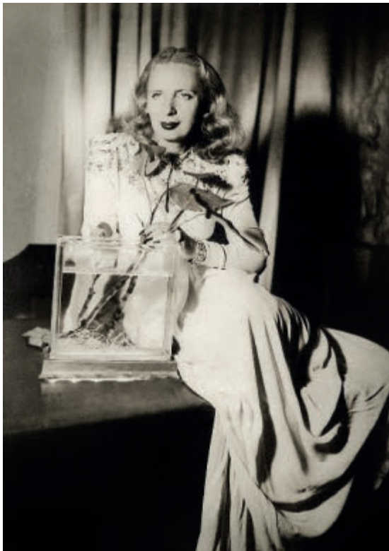
1. Tamara Łempicka w swoim nowojorskim apartamencie, 1954