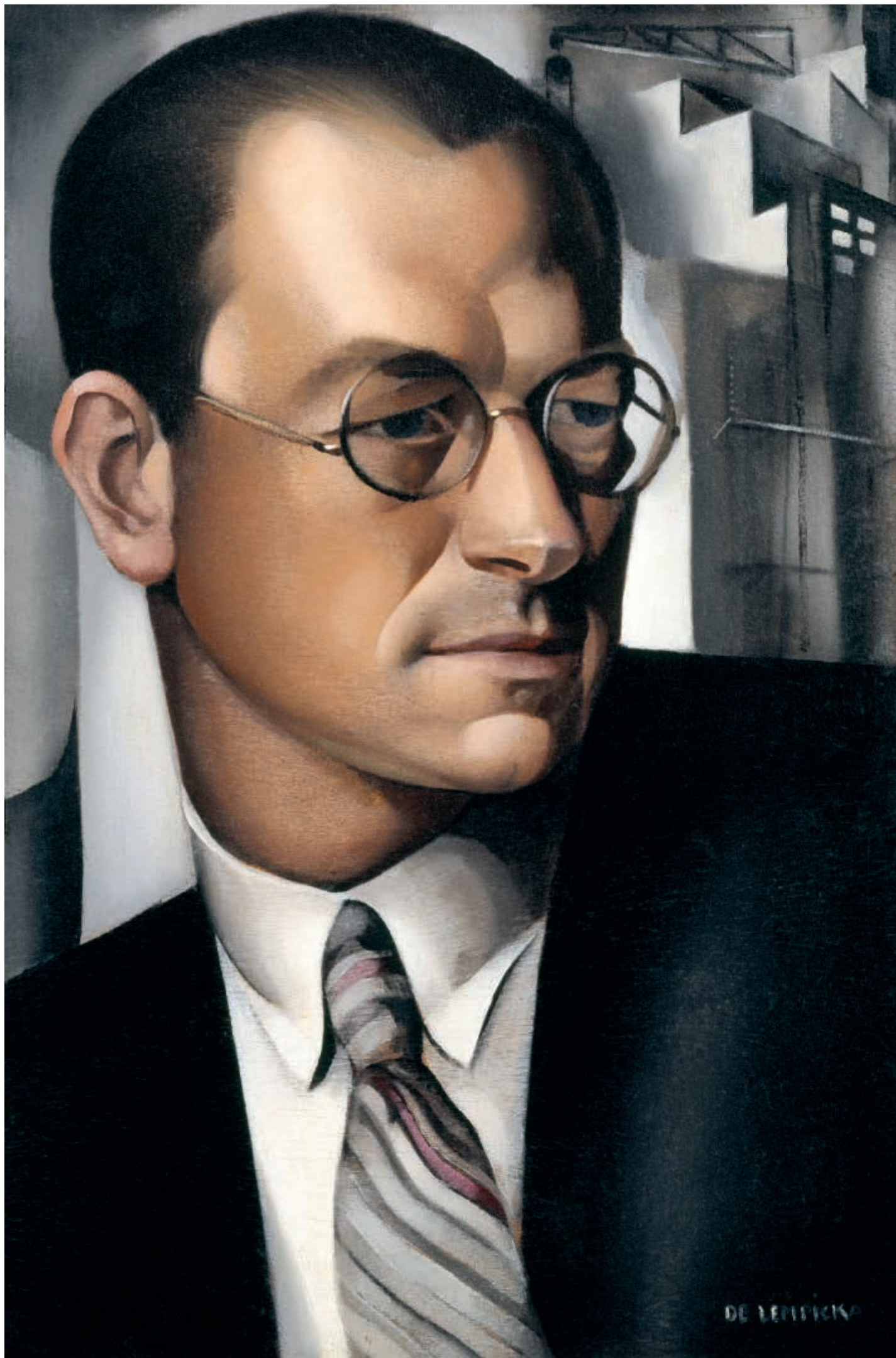
51. Portret Pierre'a de Montaut (Portrait de Pierre de Montaut), 1931, olej na desce, 41 x 27 cm