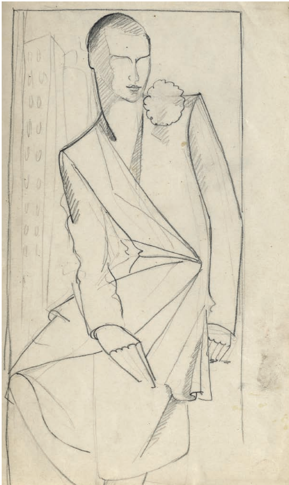
77. Studium do obrazu „Portret pani Bush” I (Étude pour le «Portrait de Mrs. Bush» I), 1929, kredka Conté na papierze, 14,5 × 7,1 cm