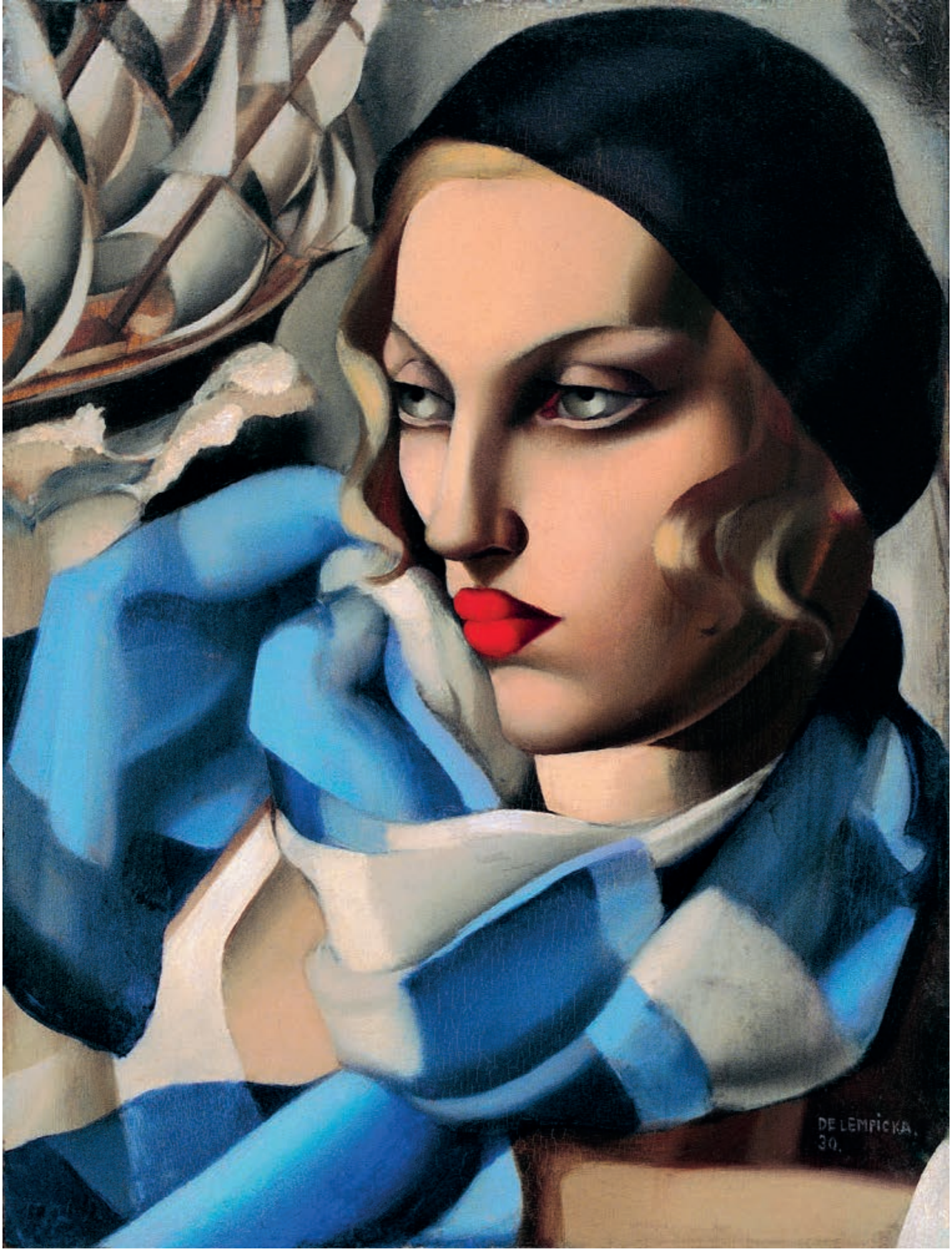
50. Błękitny szal (L'écharpe bleue), 1930, olej na desce, 35 × 37 cm