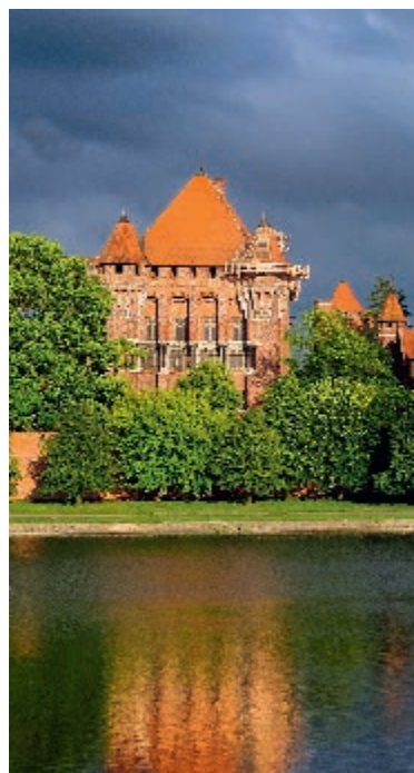
Średniowieczny zamek w Malborku