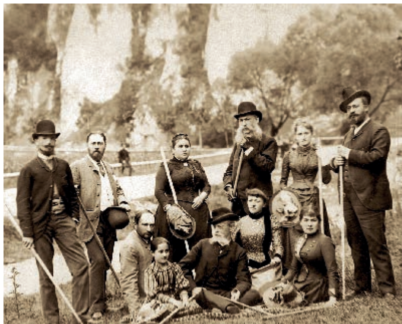
Turyści w Ojcowie, koniec XIX wieku

Among the images, the most eye-catching are the views of Krakowskie Przedmieście by Karol Beyer, a pioneer of photography in Warsaw, and the works of Ignacy Krieger, an artist working in Kraków and author of many outstanding portraits. We show two of his unique photographs, which immortalized St. Mary's Basilica and the Kraków Cloth Hall building before the reconstruction cleansed it of the ugly, unsightly outbuildings.