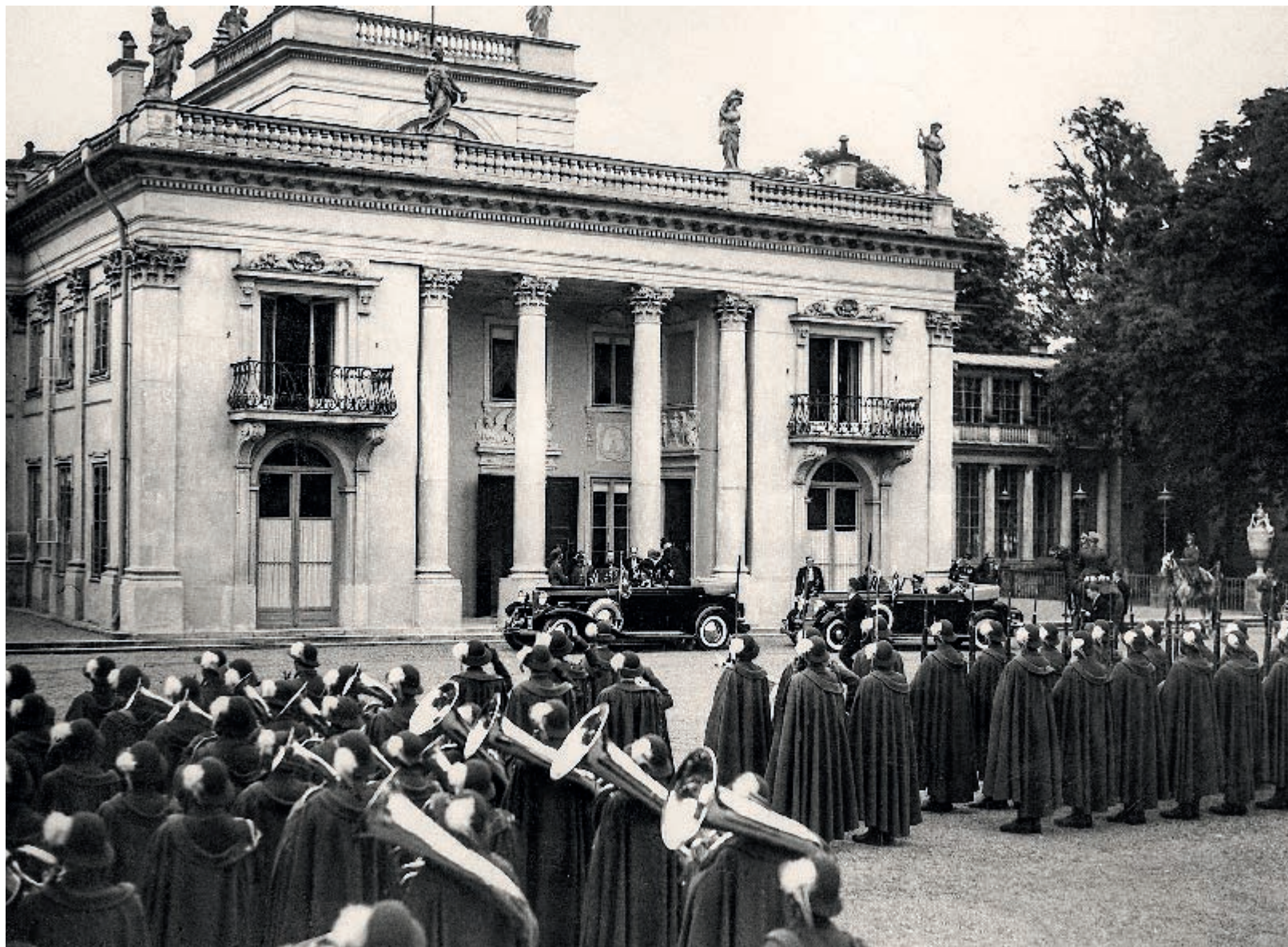
Łazienki Królewskie. Wizyta oficjalna króla Rumunii Karola II i rumuńskiego następcy tronu, księcia Michała w Polsce, czerwiec 1939 roku