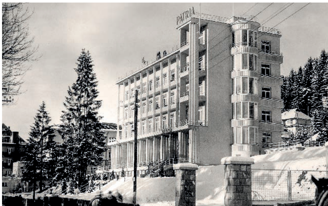
Hotel Patria, własność Jana Kiepurę, lata 1934–1939 Patria Hotel, owned by Jan Kiepura, 1934–1939