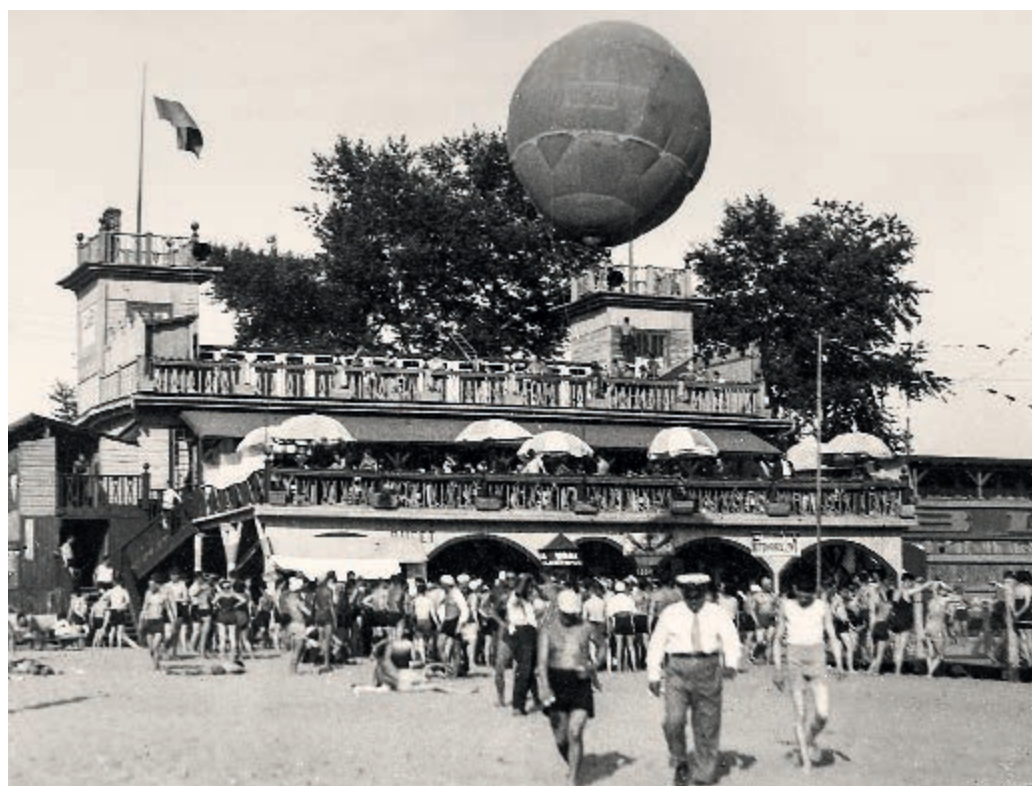
Plaża „Poniatówka” nad Wisłą, lata 30. XX wieku “Poniatówka” Beach on the Vistula River, 1930s