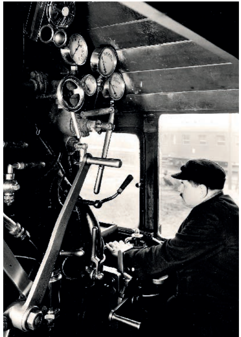
Wnętrze parowozu, lata 30. XX wieku The interior of a steam locomotive, 1930s

The front of an Ok 22 steam locomotive. Visible are a man and a notice board warning about crossing the tracks. Propaganda photo, 1937