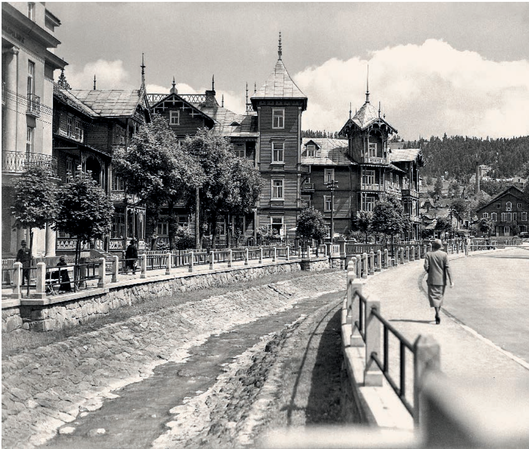
Wille przy bulwarze, 1926 rok Villas along the boulevard, 1926