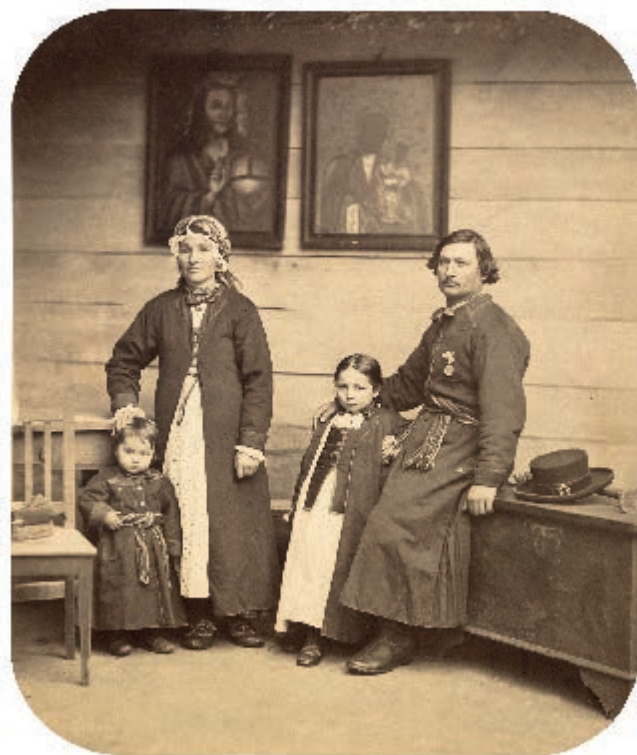
Peasant family from the neighbourhood of Wilanów, ca. 1865