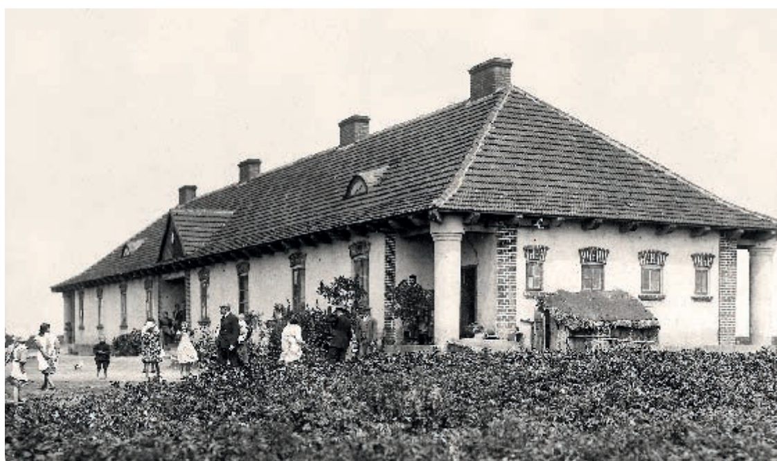
Budynek mieszkalny służby folwarcznej, majątek Morzyce, 1925 rok

Hunting in the Nacpolsk woods belonging to Zbigniew Charzyński, 1937