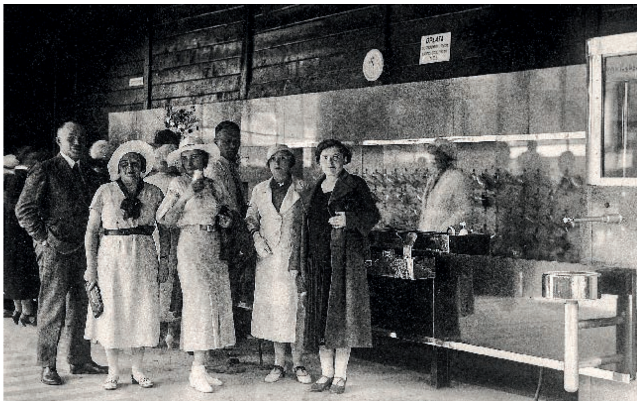
Kuracjusze w pijalni wód mineralnych, lata 1933–1939 Patients in the mineral water pump room, 1933–1939