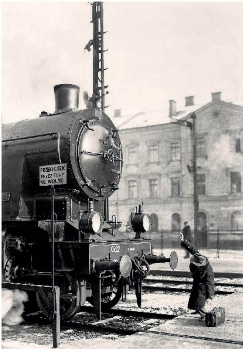
Przód parowozu Ok 22. Widoczny mężczyzna i tabliczka ostrzegająca przed wchodzeniem na tory. Zdjęcie propagandowe, 1937 rok

The front of an Ok 22 steam locomotive. Visible are a man and a notice board warning about crossing the tracks. Propaganda photo, 1937