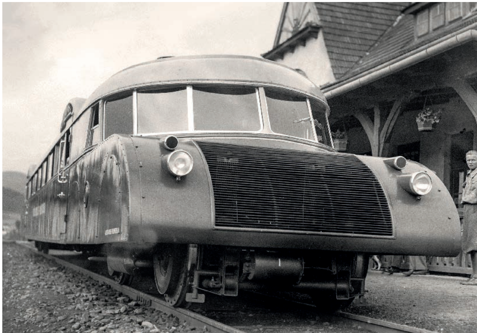
Pociąg spalinowy kursujący na trasie Kraków-Zakopane, tzw. Luxtorpeda, 1933 rok Diesel train running on the Kraków-Zakopane route, known as the Luxtorpeda, 1933