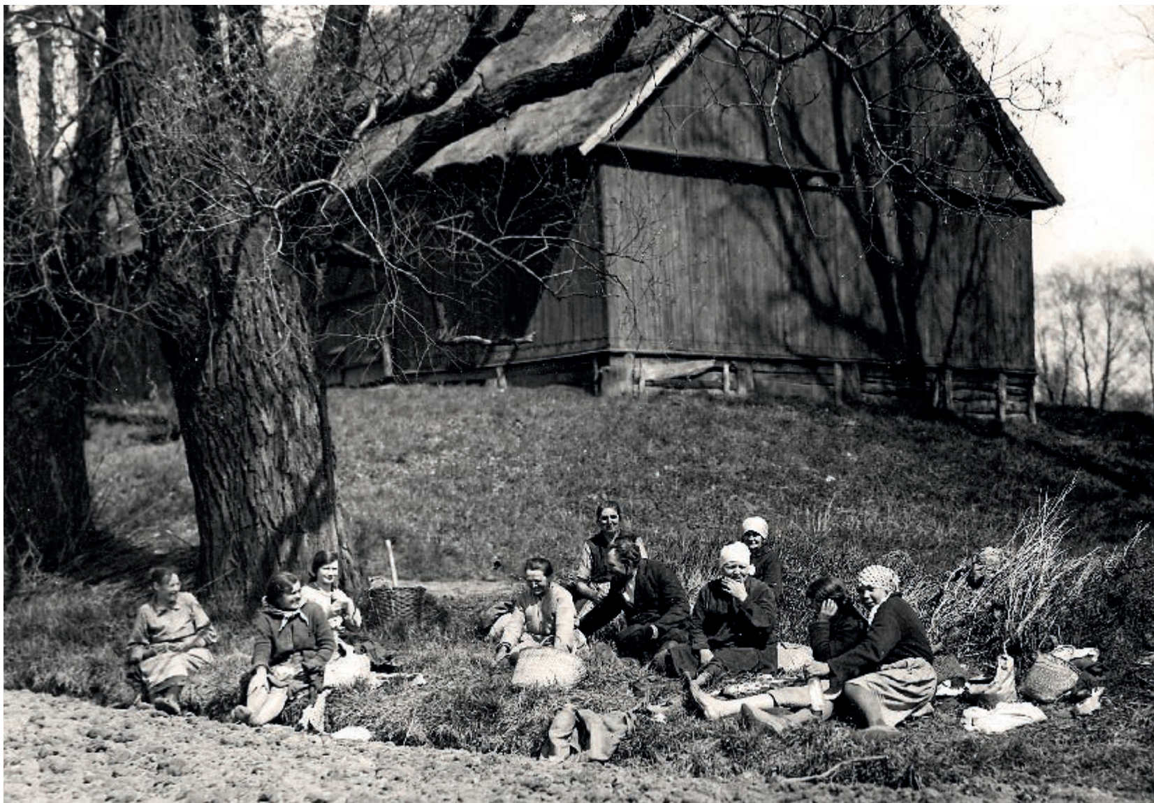
Odpoczynek podczas wiosennych prac polowych, 1932 rok Rest during spring field work, 1932