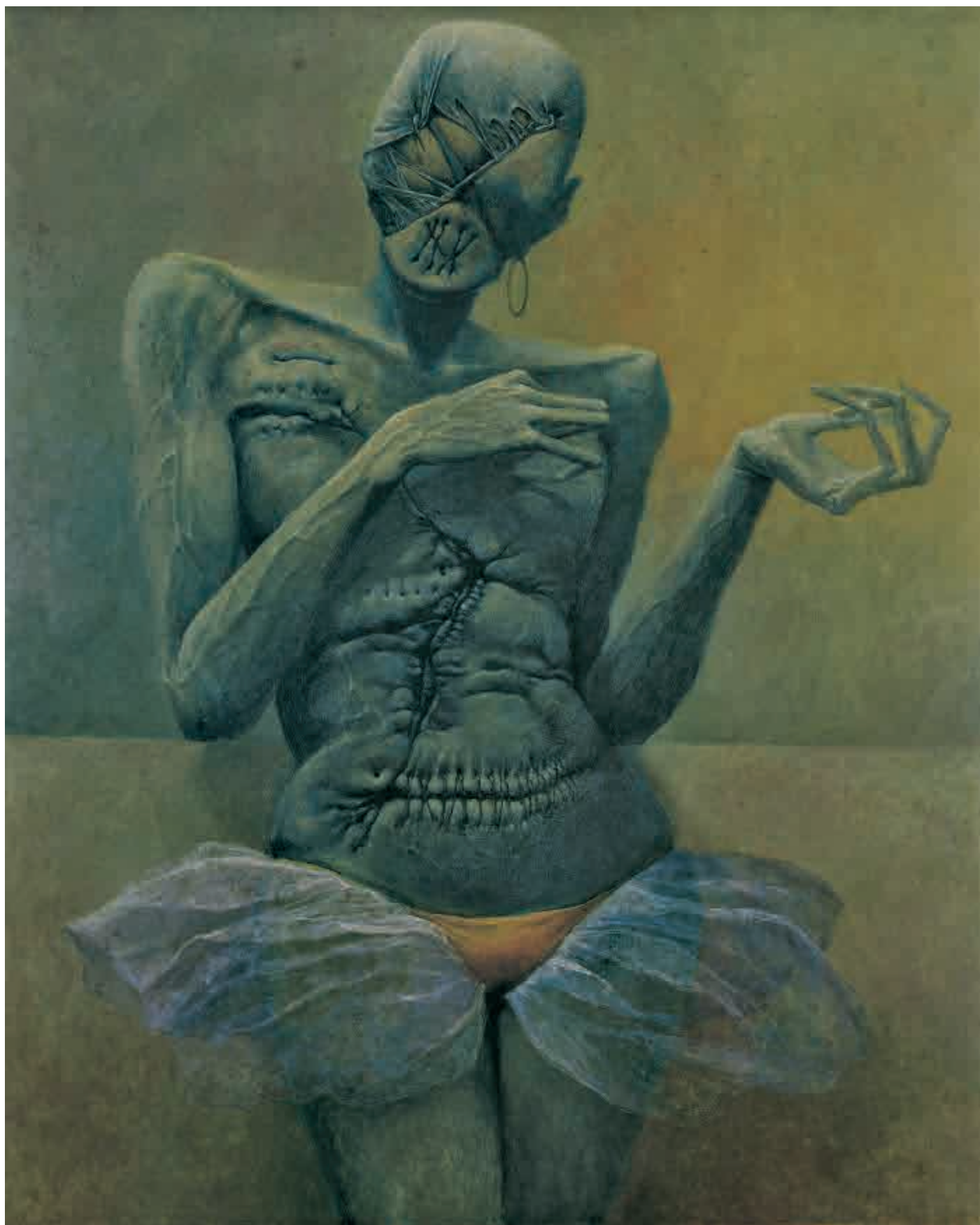
AB69 , 1969, olej na desce, 125 × 101 cm