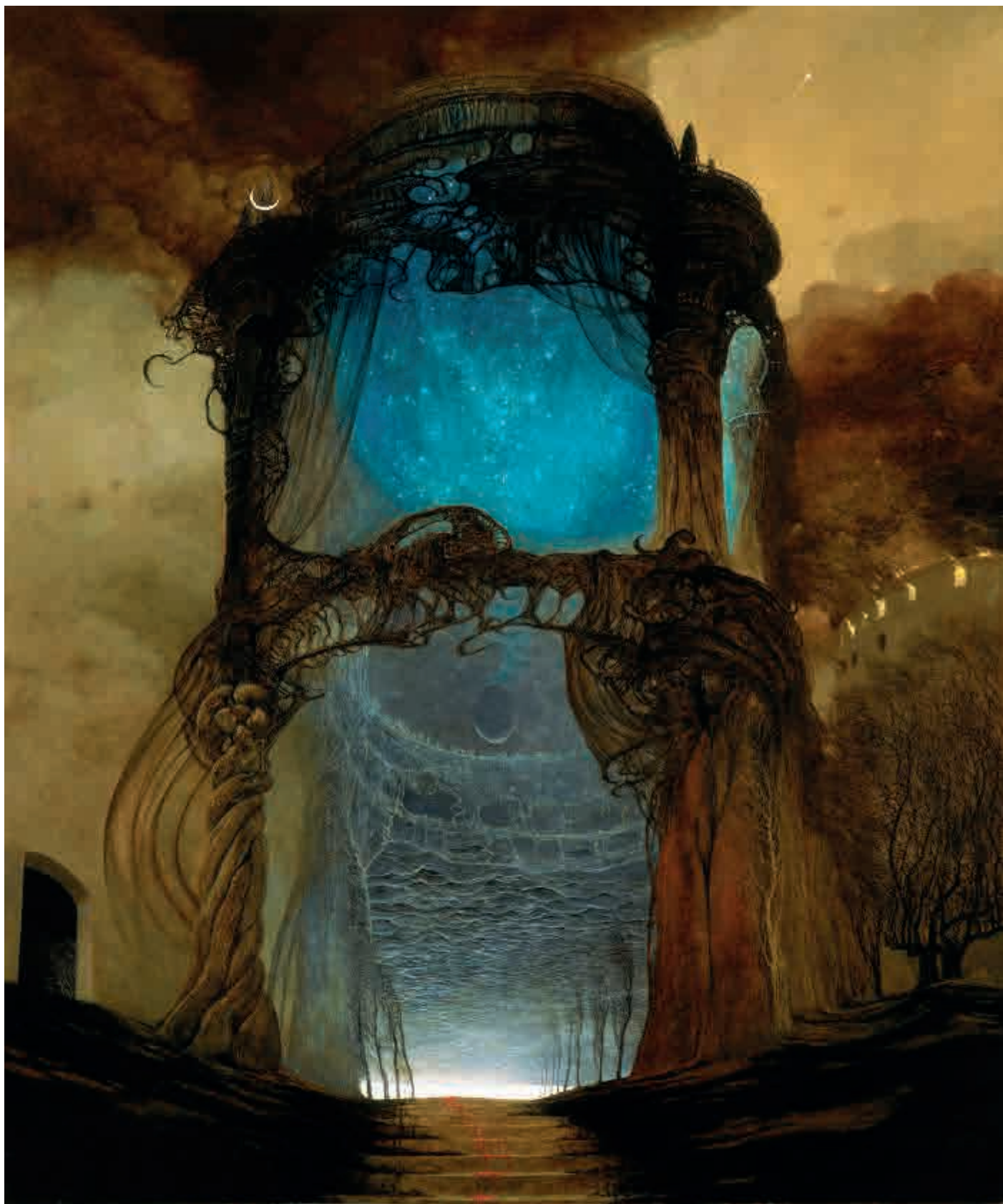
AE78, 1978, olej na desce, 87 × 73 cm AE78, 1978, oil on board, 87 × 73 cm