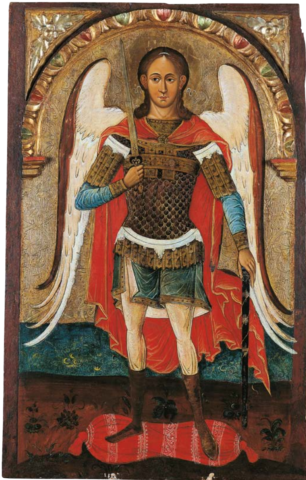
Archanioł Michał, 1 połowa XVII w. Lipie, z cerkwi pw. Soboru Matki Boskiej 107 × 68 cm