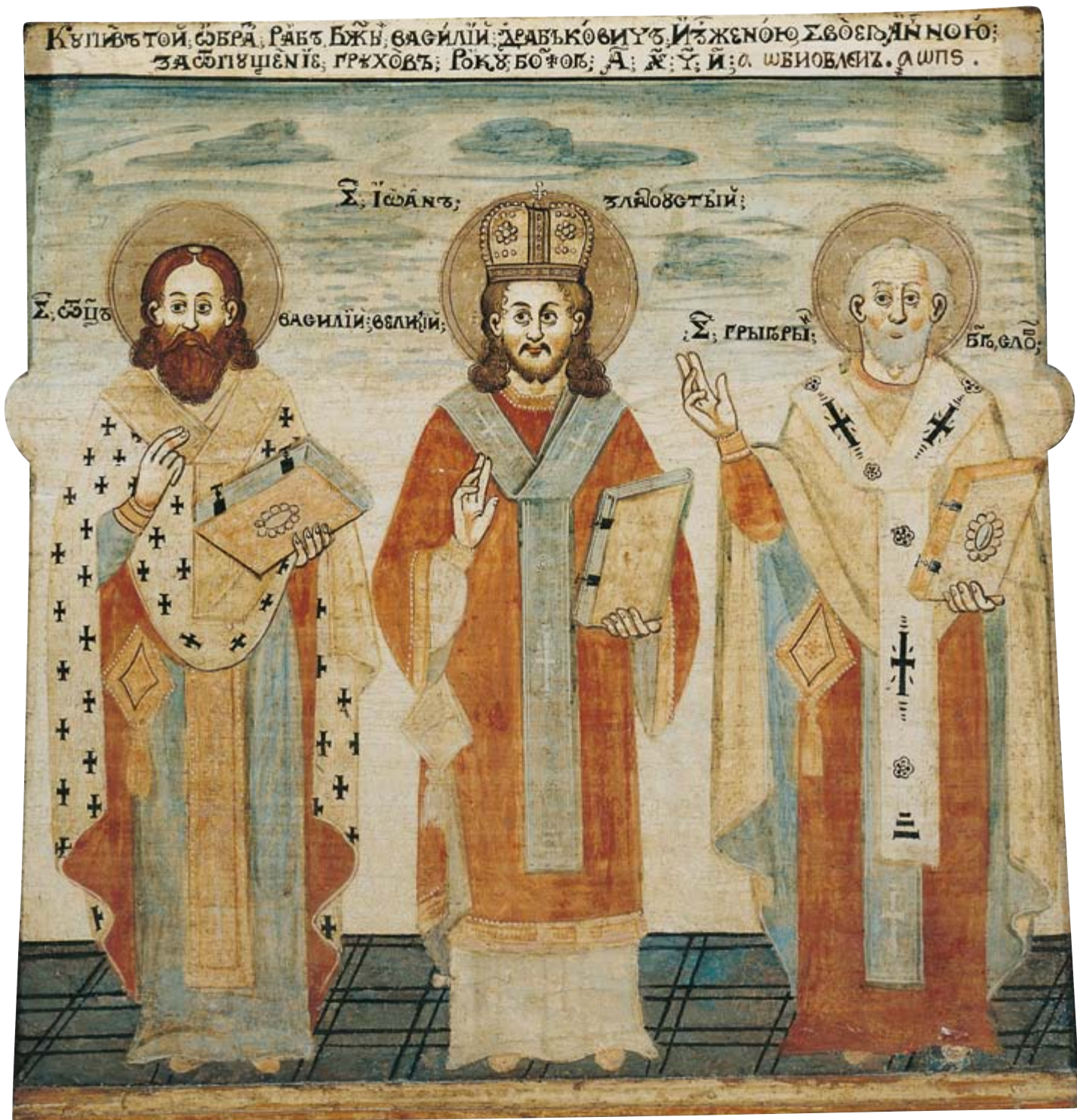
Śś. Bazyli Wielki, Jan Złotousty i Grzegorz z Nazjanzu, 1698 r. Ustianowa, z cerkwi pw. św. Paraskewy Tyrnowskiej 85,5 × 89,5 cm