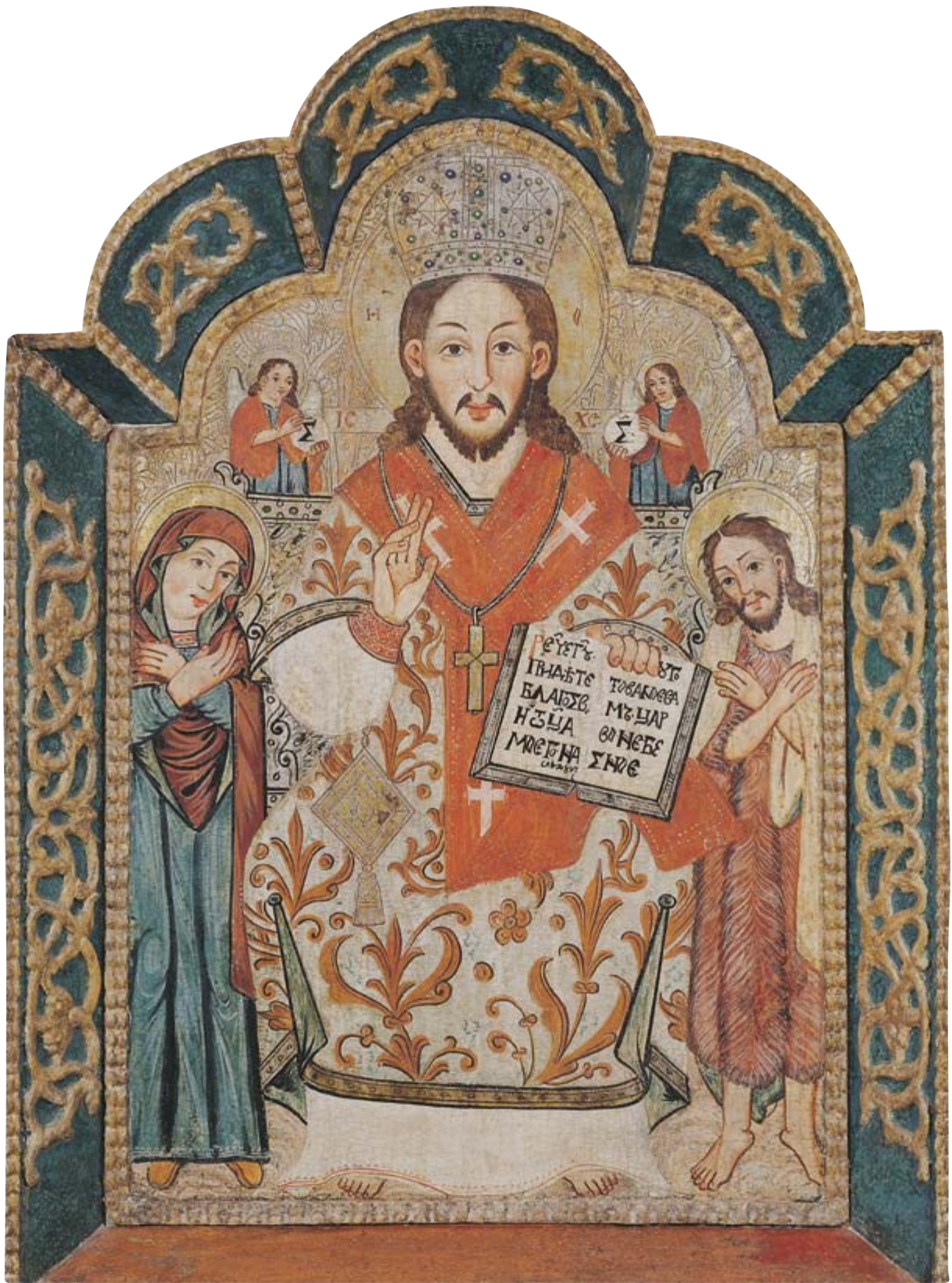
Deesis, 1698 r. Ustianowa, z cerkwi pw. św. Paraskewy Tyrnowskiej 150 × 125 cm