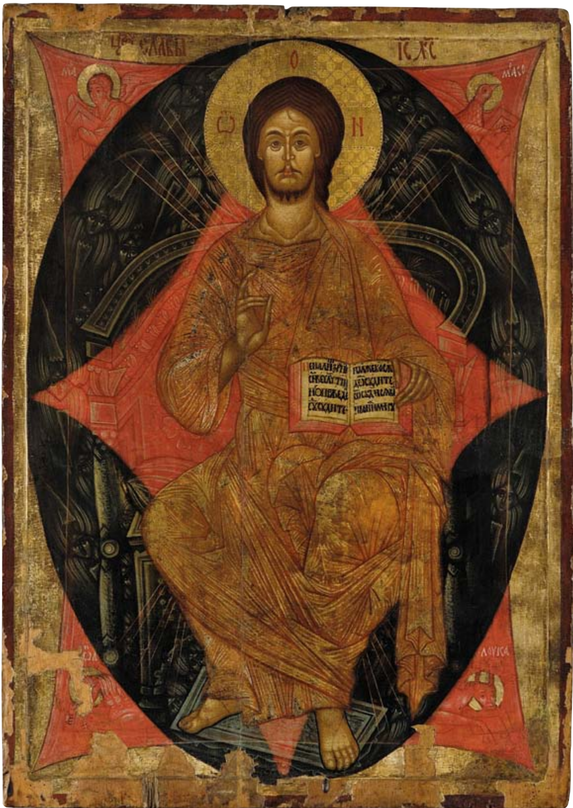
Chrystus Pantokrator, 2 połowa XV w. Nowosielce, z cerkwi pw. Matki Boskiej Pokrow 120 × 86 cm