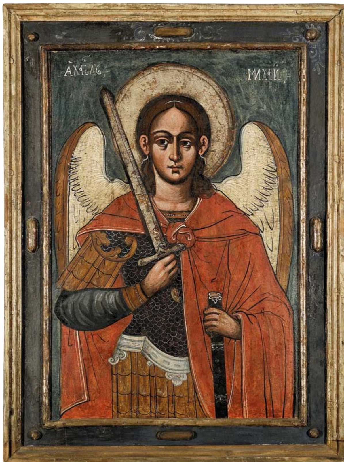
Archanioł Michał, 1 połowa XVII w. Stańkowa, z cerkwi pw. Soboru Matki Boskiej 65 × 47 cm