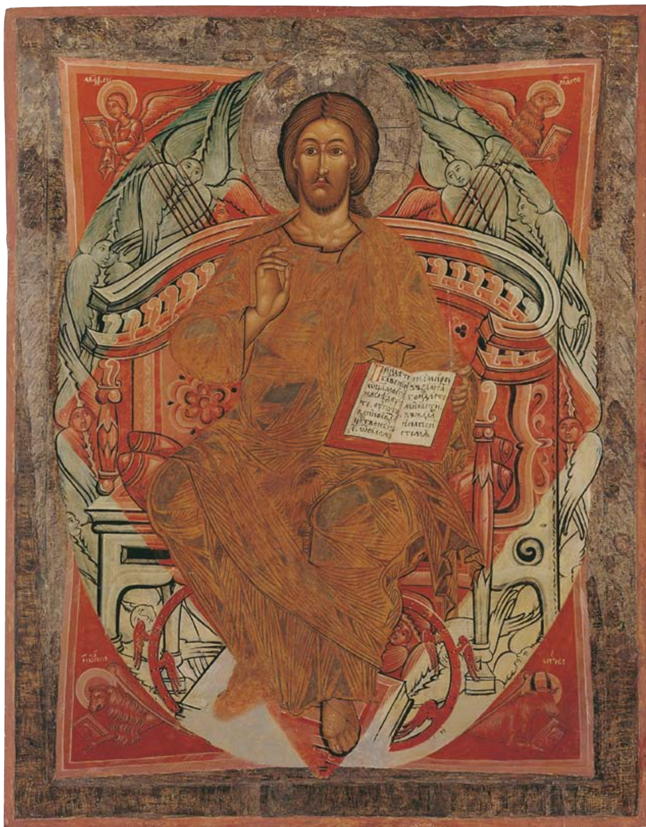
Chrystus Pantokrator, 2 połowa XVI w. Surowica, z cerkwi pw. Zaśnięcia Matki Boskiej 110 × 85,5 cm