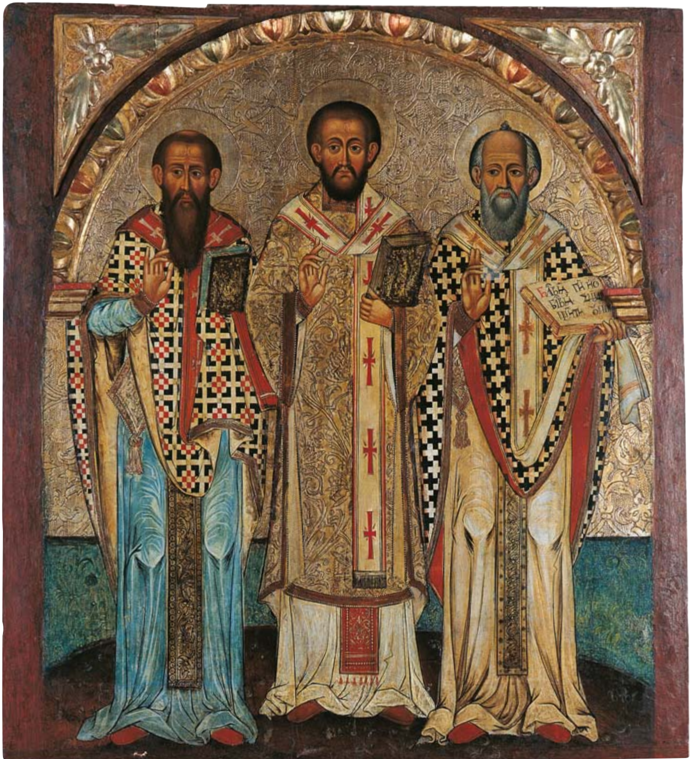
Śś. Bazyli Wielki, Jan Złotousty i Grzegorz z Nazjanzu, XVII w. Lipie, z cerkwi pw. Soboru Matki Boskiej 105 × 98 cm