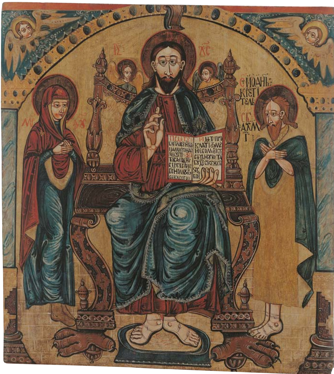
Deesis, 1643 r. Krempna, z cerkwi pw. św. Kosmy i Damiana 173 × 127 cm