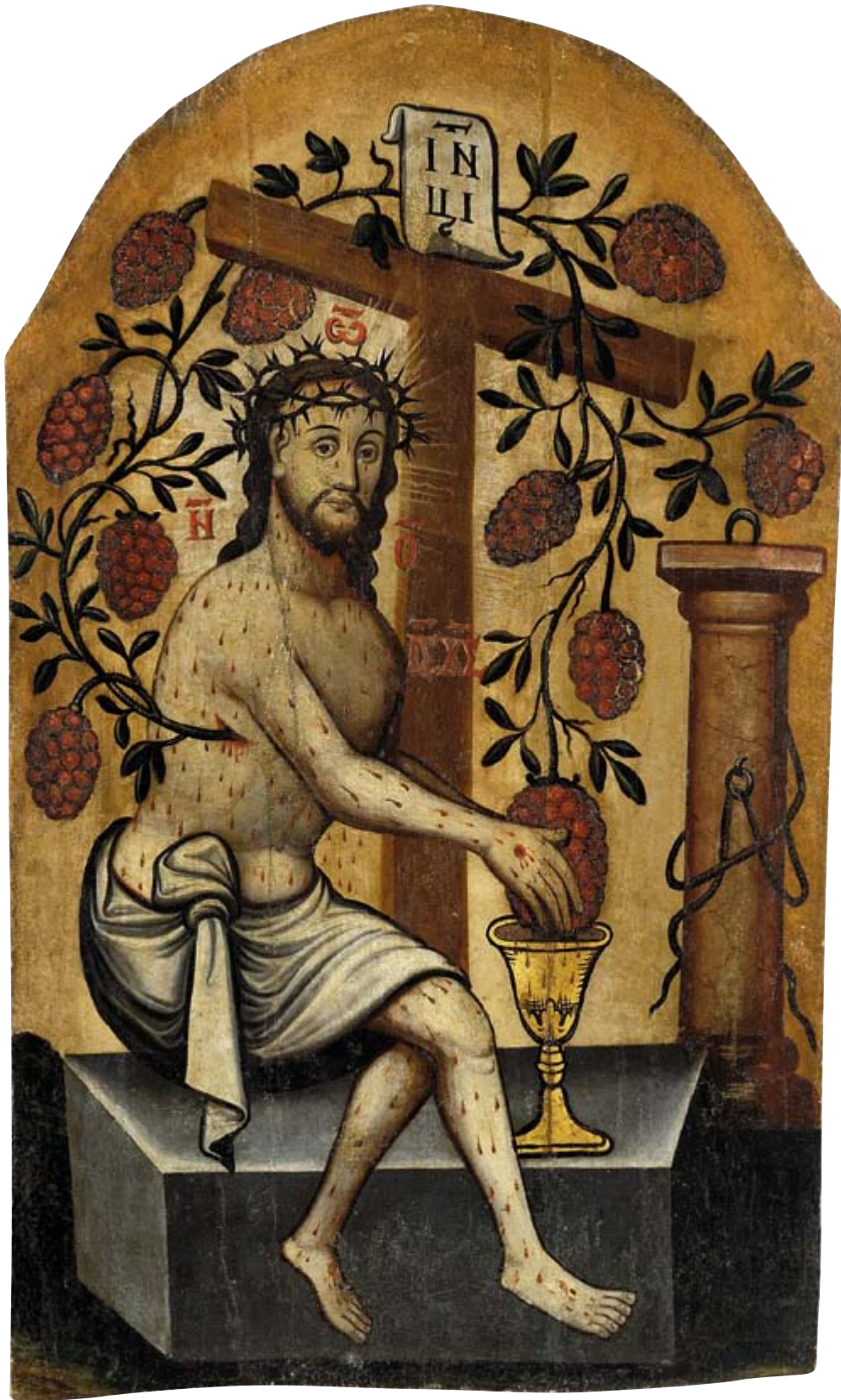
Chrystus Eucharystyczny, XVIII w. pochodzenie nieznanne 104 × 61,5 cm