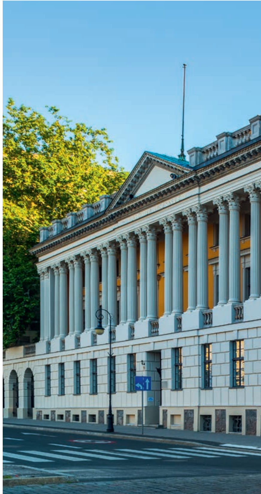
Zamek Cesarski – Centrum Kultury Zamek w Poznaniu