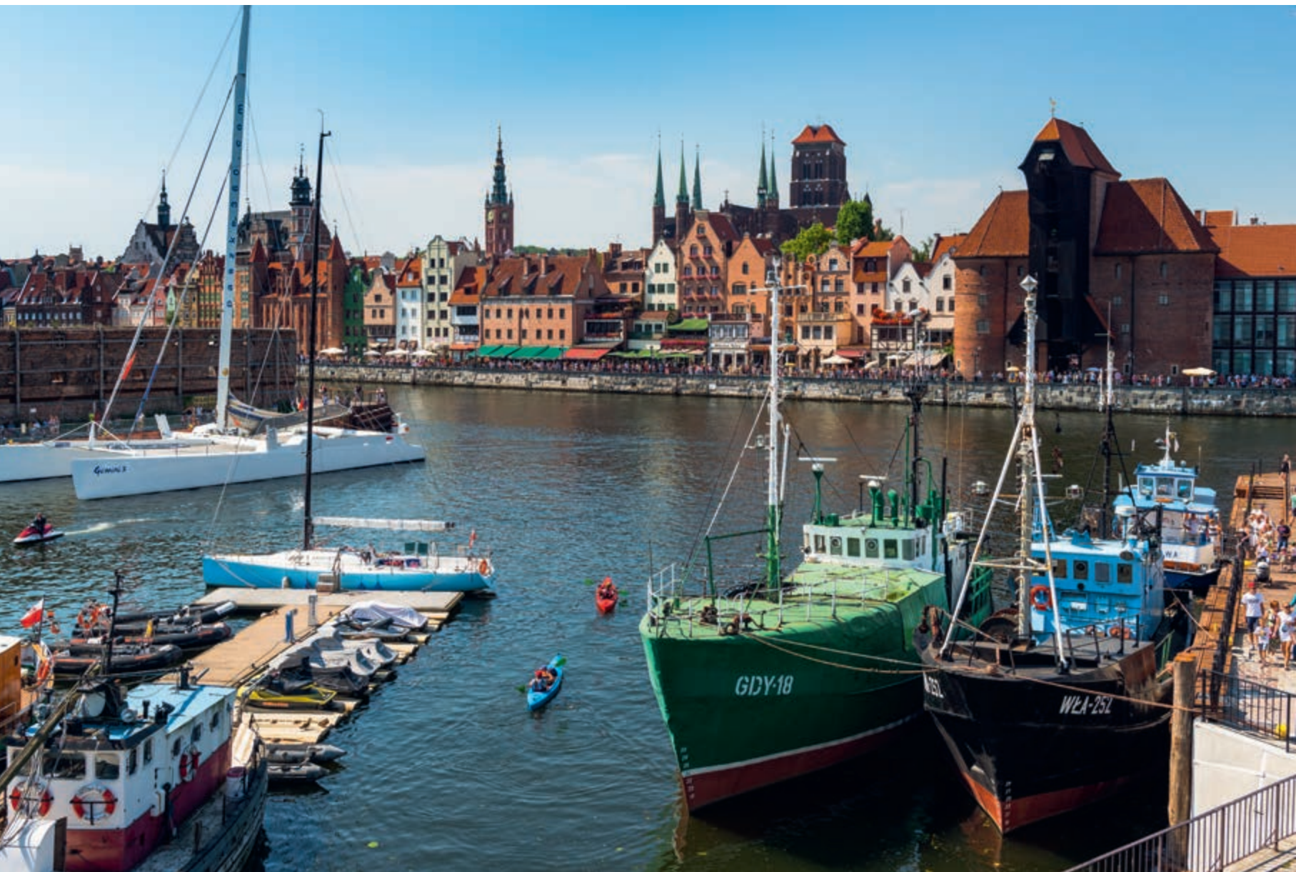
Pomorskie Szlaki Kajakowe - Szlak Motławy i Martwej Wisły w Gdańsku