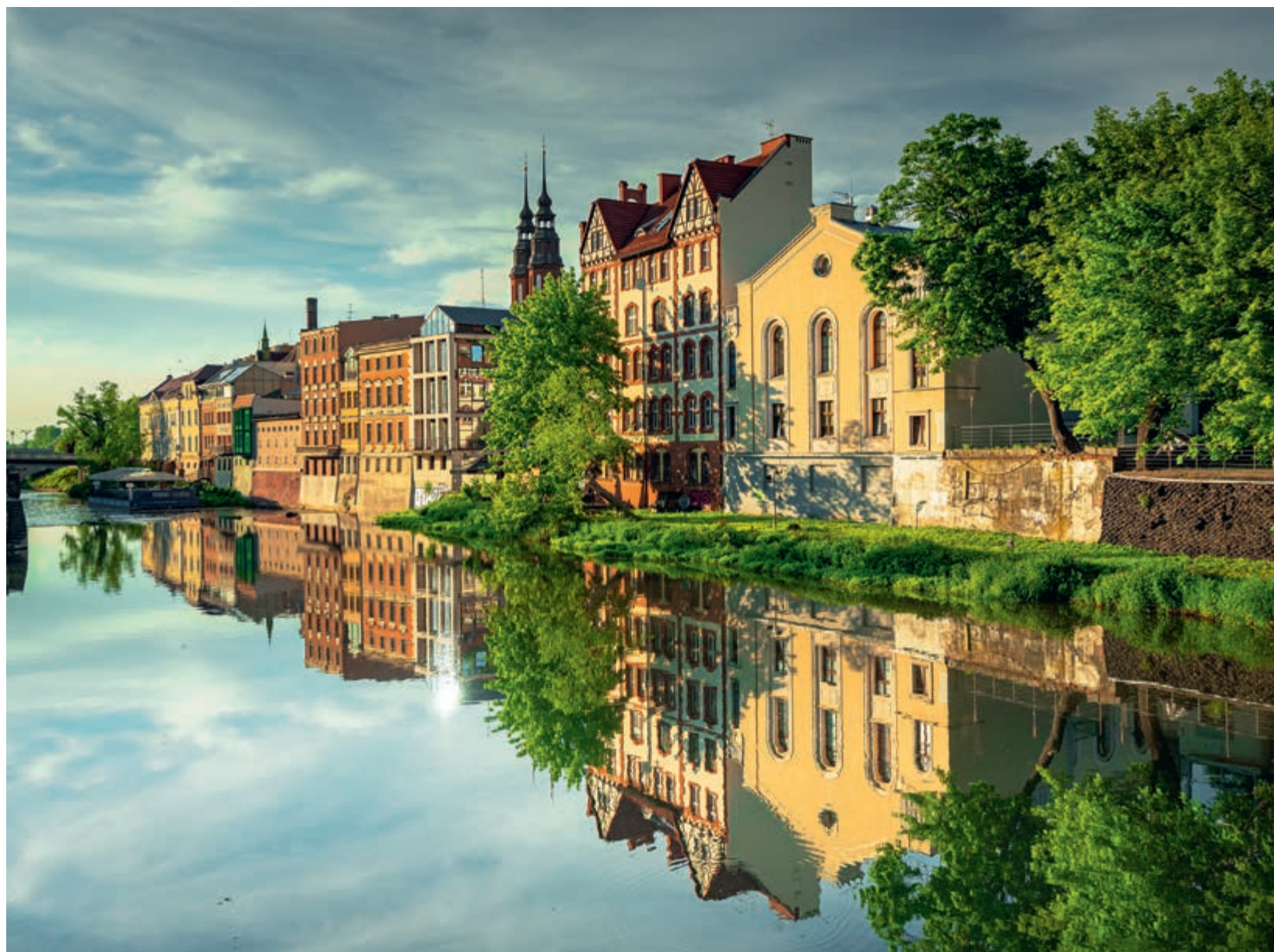
Bulwary nad Młynówką w Opolu