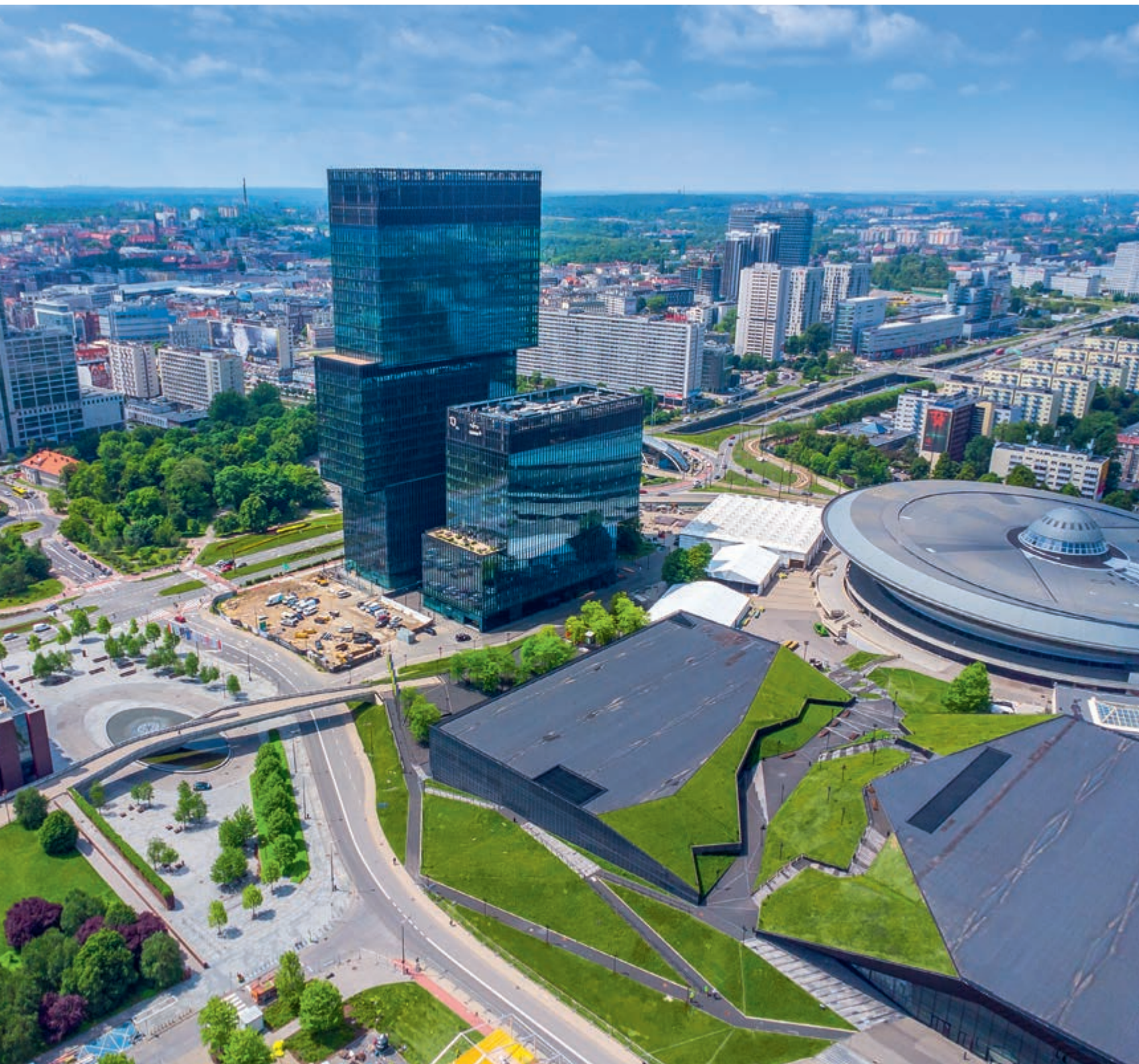
Międzynarodowe Centrum Kongresowe z Halą Widowiskowo-Sportową „Spodek” w Katowicach