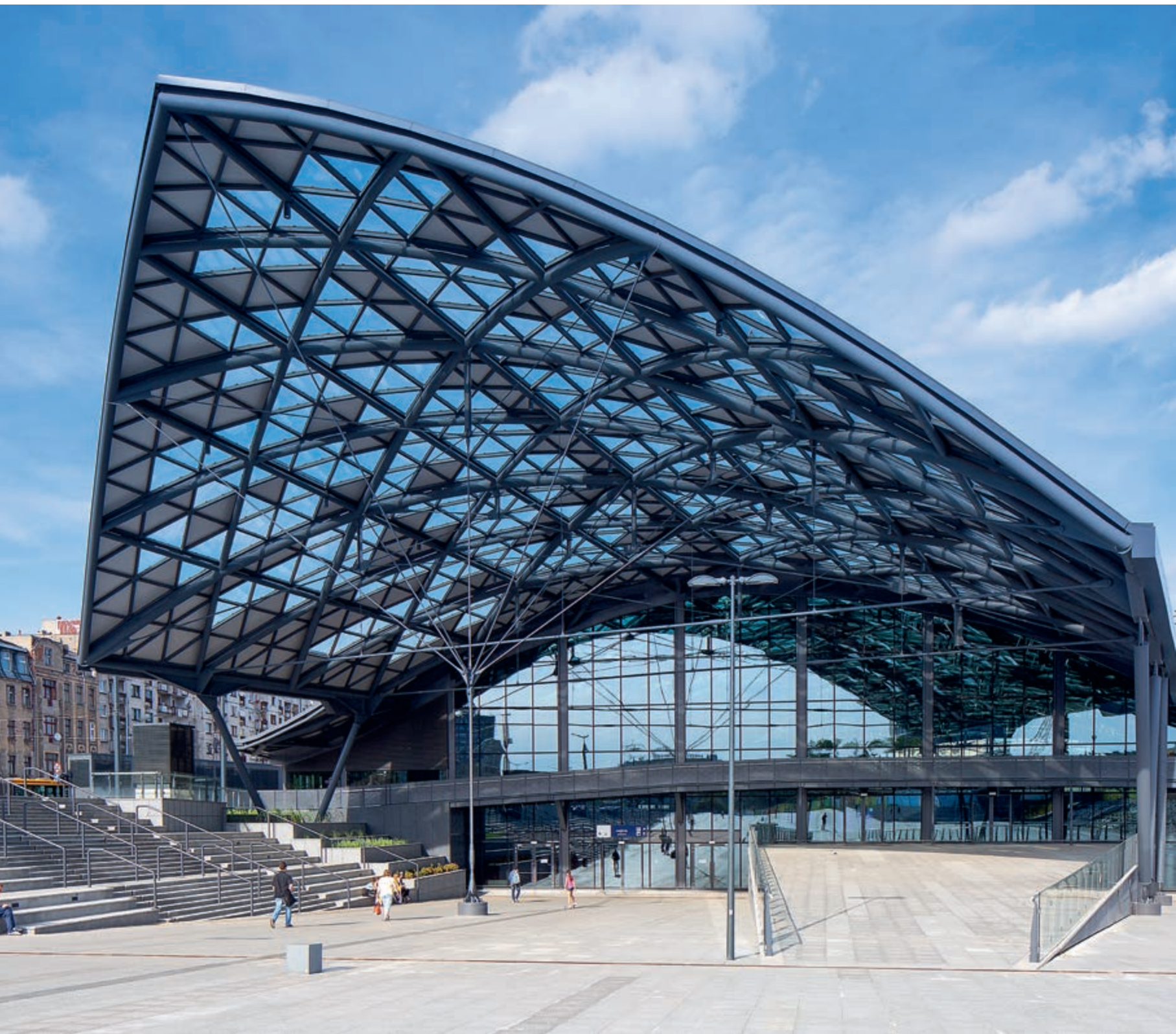
Dworzec Łódź Fabryczna w Łodzi