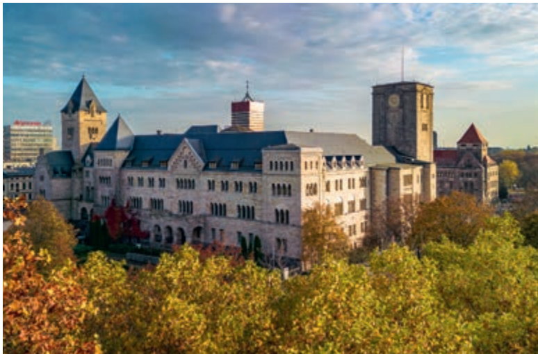
s. 192-193 Białolecki Ośrodek Kultury w Warszawie