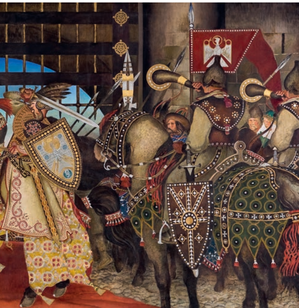
Wjazd Chrobrego do Kijowa 1928 olej na płótnie 205 × 401 cm