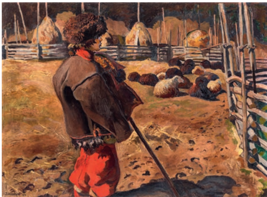
Hucul z owcami 1906 olej na płótnie 98 × 132 cm