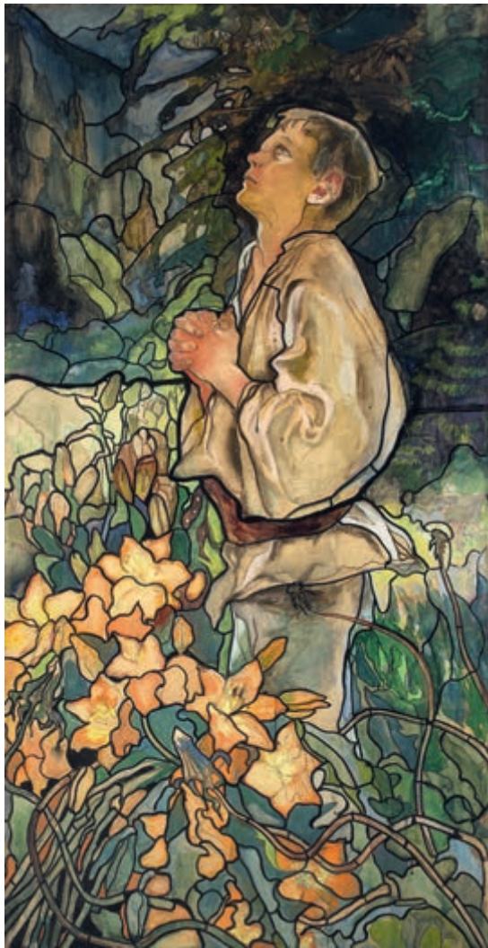
Wiosna (tryptyk) 1909 akwarela, tempera, tusz, pastel na kartonie 145 × 76,5 cm (każda część tryptyku)