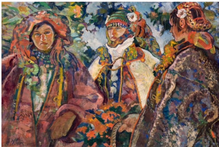
Wesele huculskie 1924 olej na tekturze 67 × 97 cm