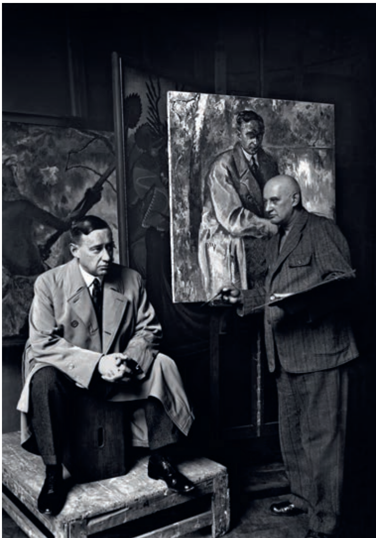
Kazimierz Sichulski portretujący Zygmunta Nowakowskiego przed 1939