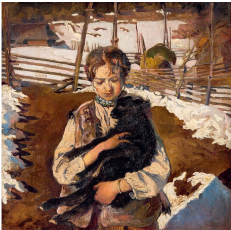
Czarne jagnię 1905 olej na płótnie 97 × 97 cm