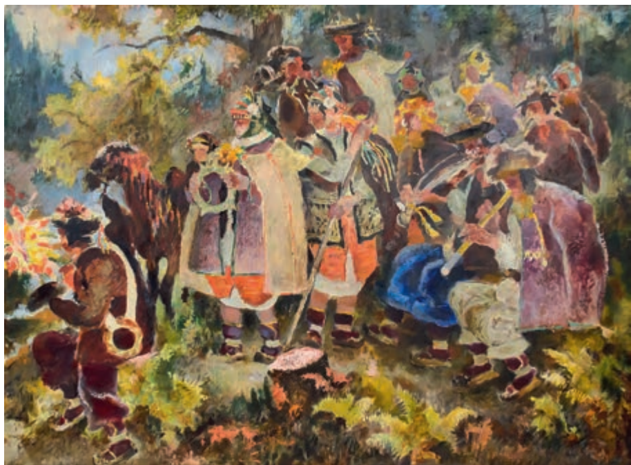
Bajka po 1914 olej na sklejcje 89,5 × 120 cm