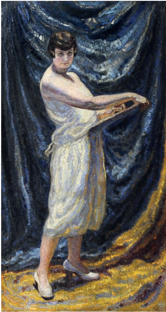
Autoportret 1929 olej na płótnie 189 × 99 cm