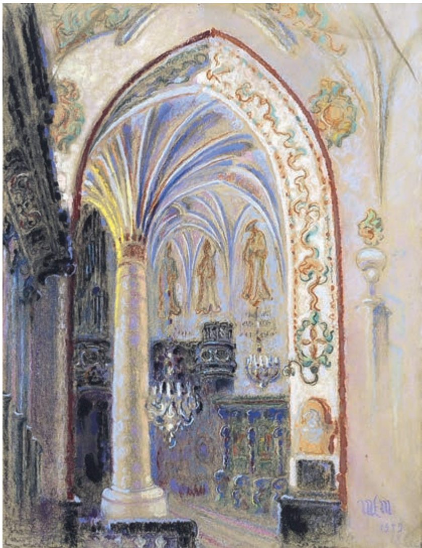
Wnętrze kościoła św. Krzyża 1949 pastel na papierze 63 × 48 cm