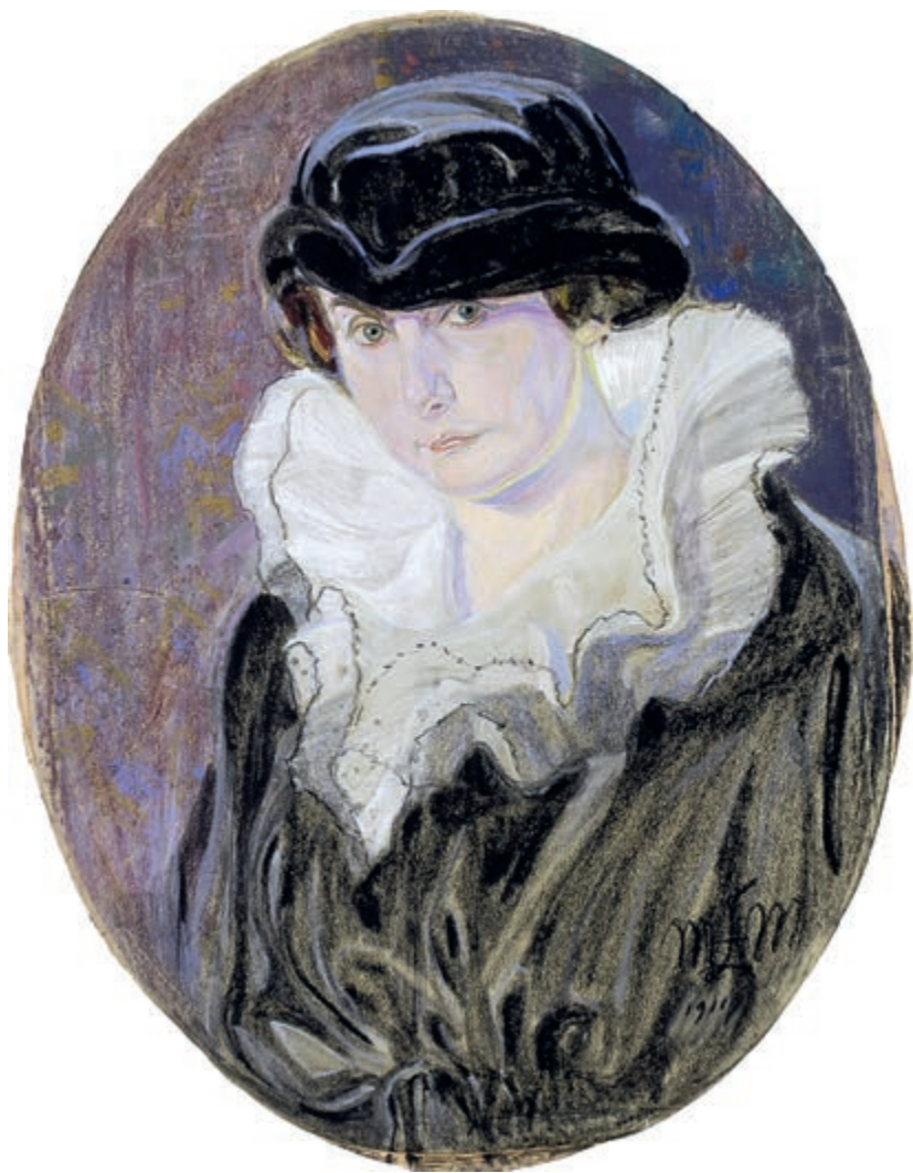
Autoportret ok. 1911 pastel na papierze 61,5 × 47,5 cm