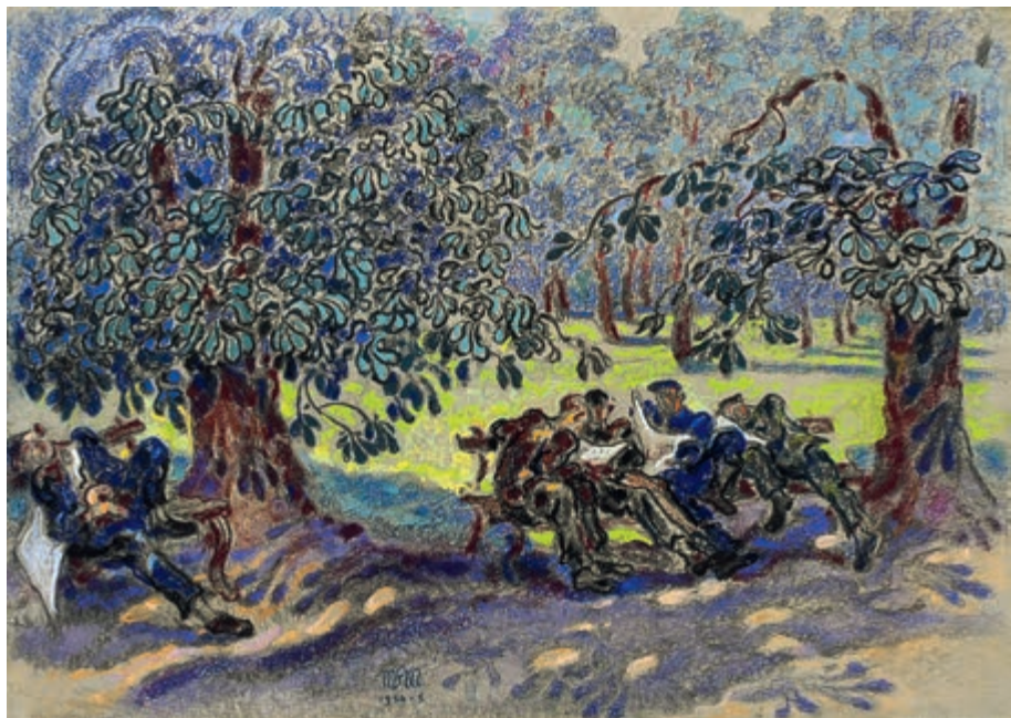
Po pracy 1955 pastel na papierze 50 × 70 cm