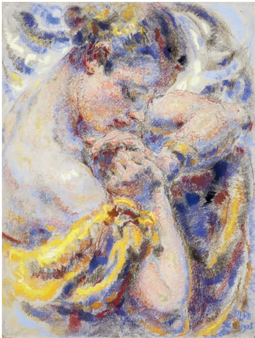
Studium portretowe kobiety 1935 pastel na papierze 62 × 47 cm