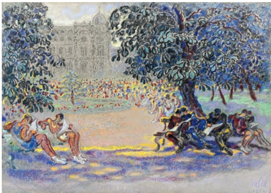
Przed teatrem 1955 pastel na papierze 50 × 70 cm