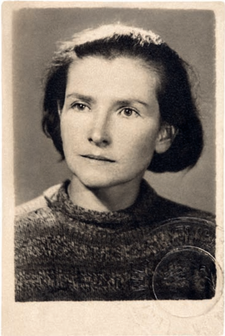
Maria Jarema lata 40. XX w.