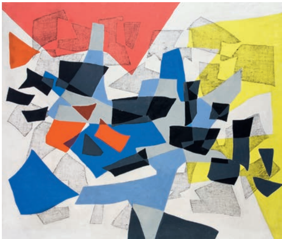
Penetracje VII 1958 monotypia, tempera, olej na płótnie 100 × 116 cm