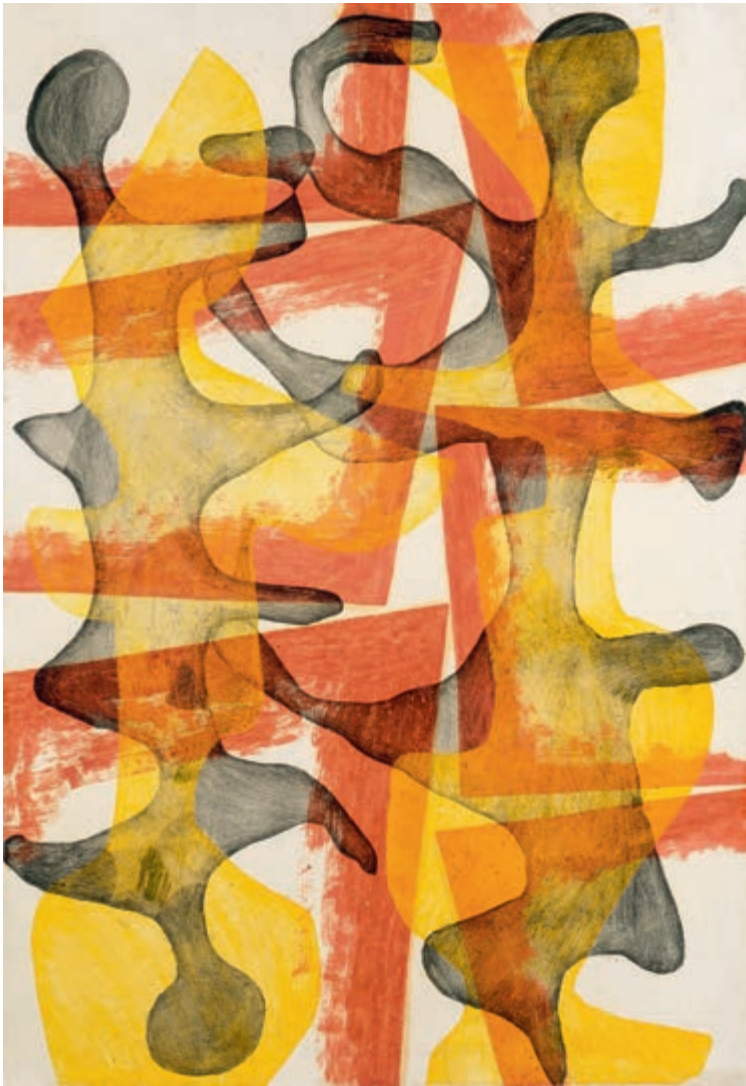
Filtry 12 1956 monotypia, olej na papierze naklejonym na płótno 100 × 70 cm