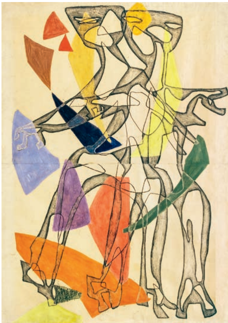
Figury 1954 monotypia, tempera na papierze 121 × 85 cm