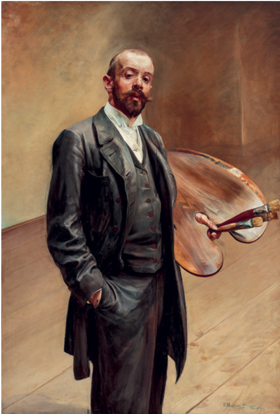
Autoportret z paletą, 1892, olej na płótnie, 160,5 × 110 cm Self-Portrait with Palette, 1892, oil on canvas, 160.5 × 110 cm