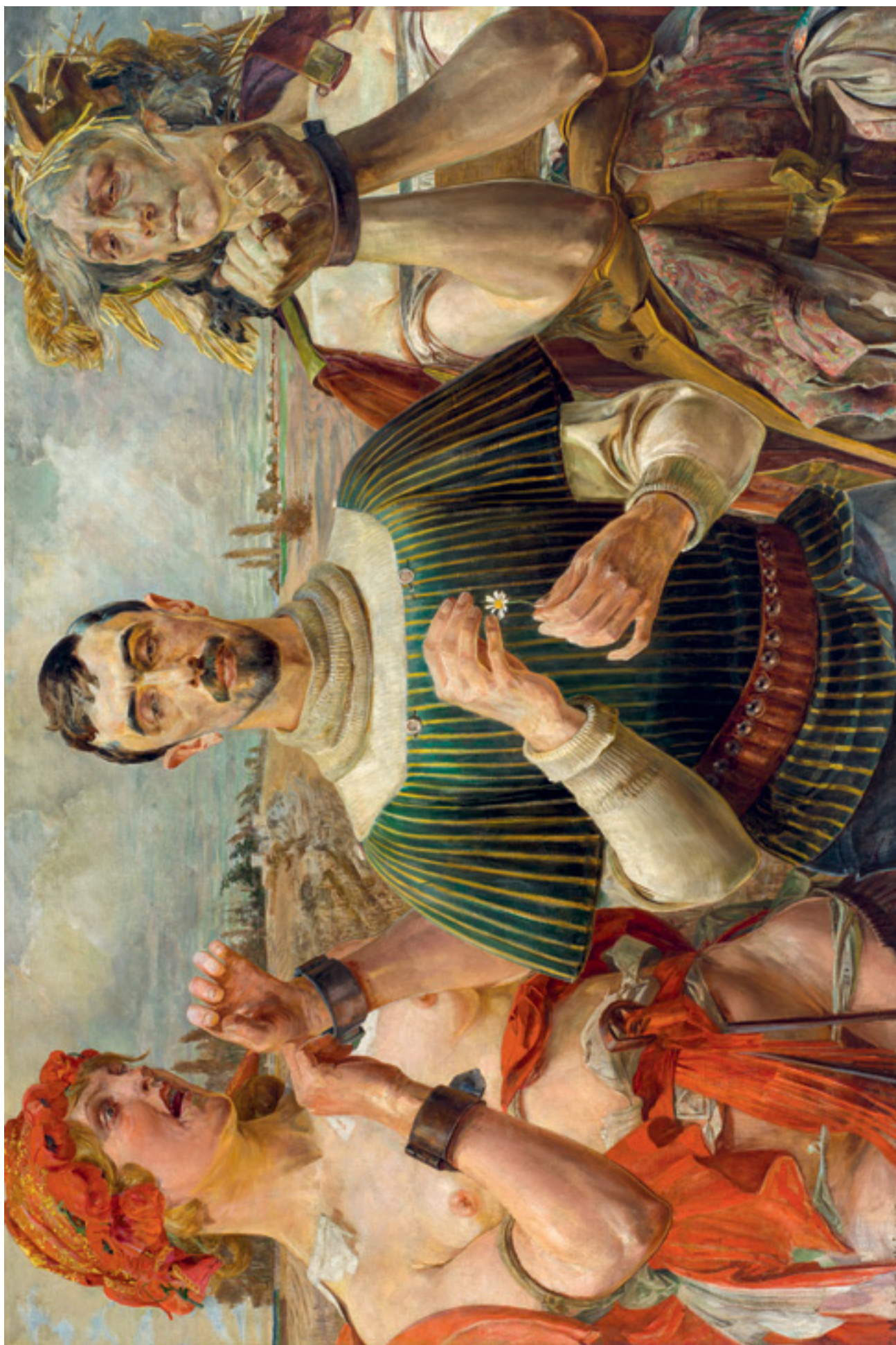
Hamlet polski – Portret Aleksandra Wielopolskiego, 1903, olej na płótnie, 100 × 148 cm Polish Hamlet – Portrait of Aleksander Wielopolski, 1903, oil on canvas, 100 × 148 cm