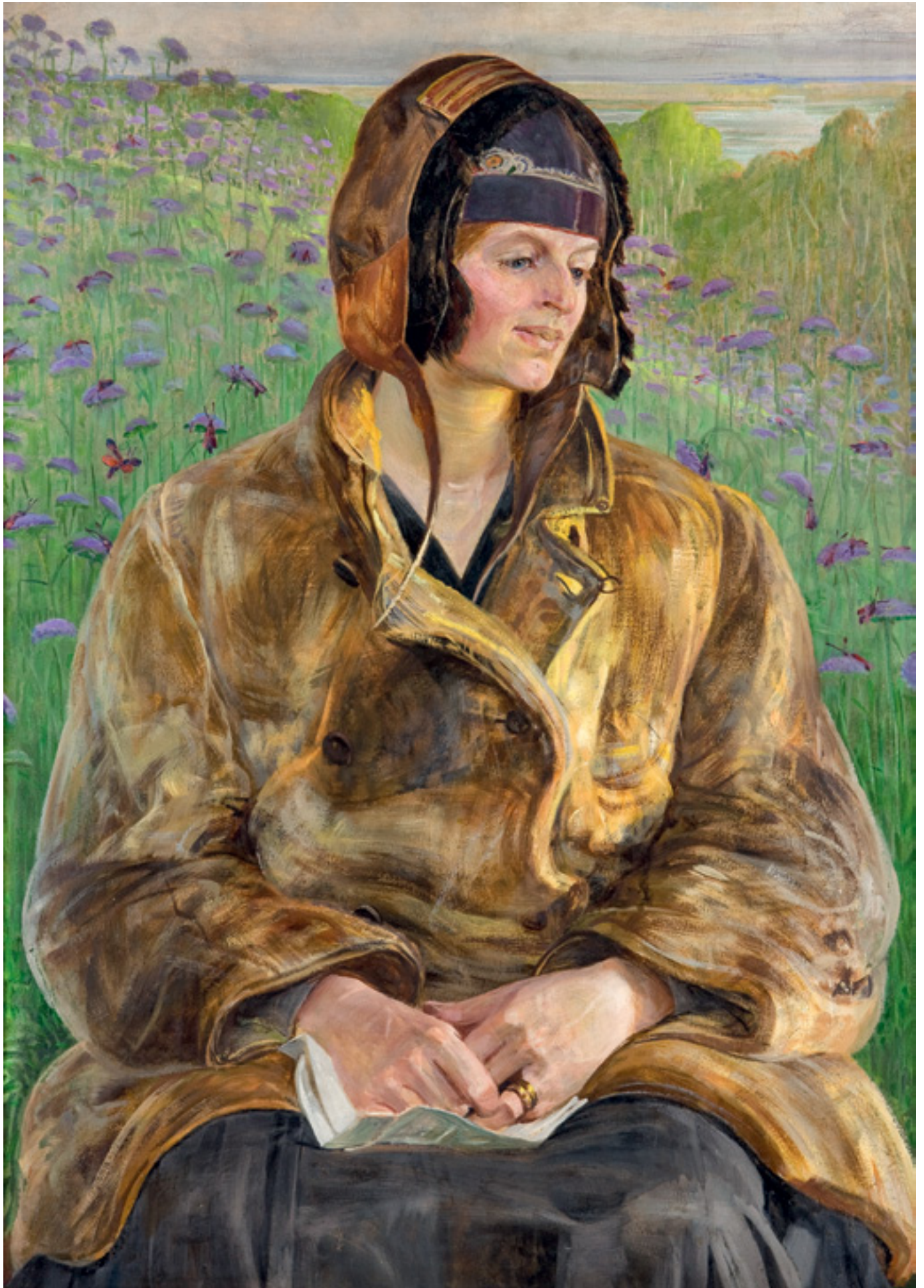
Ellenai , 1910, olej na tekturze, 100 × 70 cm Ellenai , 1910, oil on cardboard, 100 × 70 cm