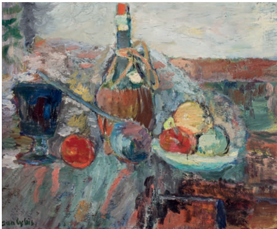
Martwa natura z butelką w plecionce 1948 olej na płótnie 70 × 73 cm