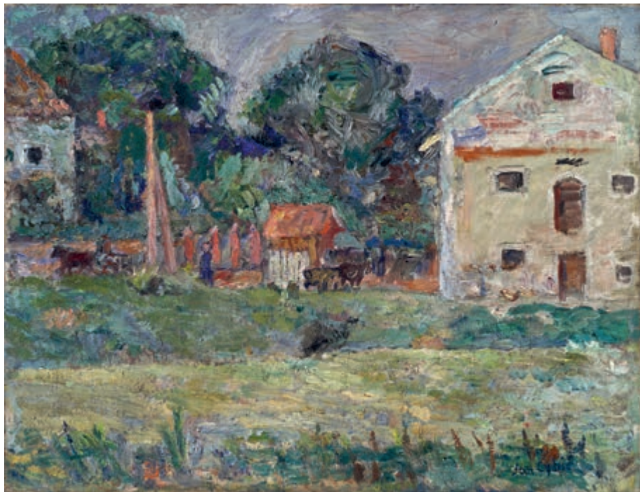
Krajobraz z wronami