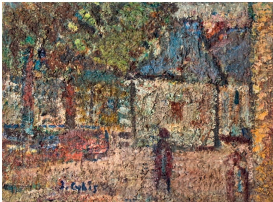
Uliczka w miasteczku 1939–1957 olej na płótnie 60 × 82 cm