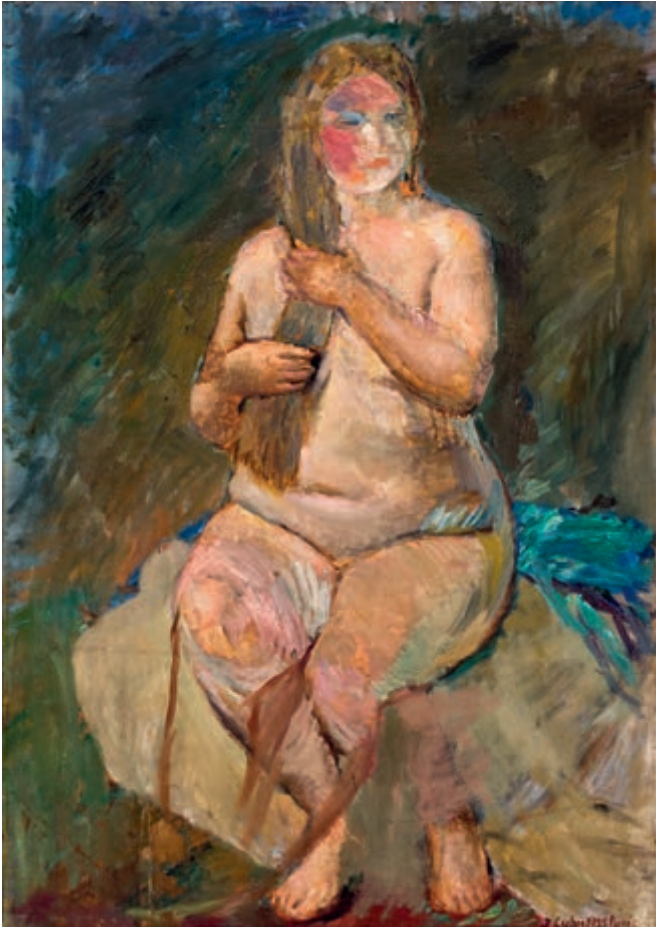
Studium z pracowni Józefa Pankiewicza w Paryżu 1925 olej na płótnie 64 × 46 cm