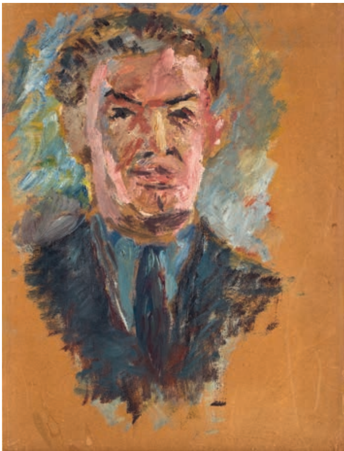
Autoportret około 1928 olej na tekturze 35 × 27 cm