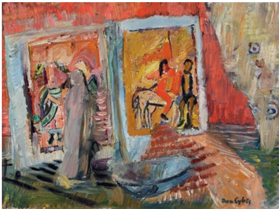
Martwa natura katalońska