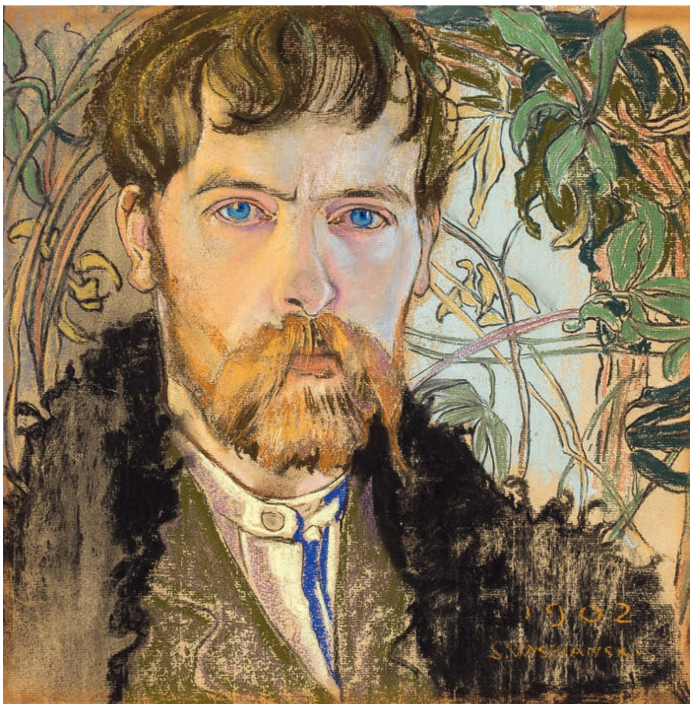
Autoportret, 1902, pastel na papierze, 37,5 × 36,8 cm Self-Portrait, 1902, pastel on paper, 37.5 × 36.8 cm