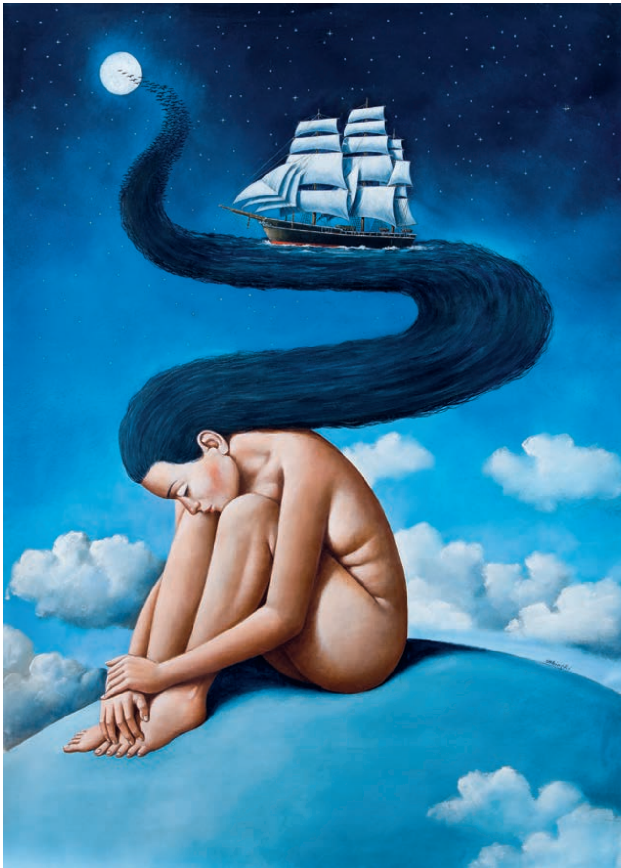
Solitude II 142 × 100 cm 2022