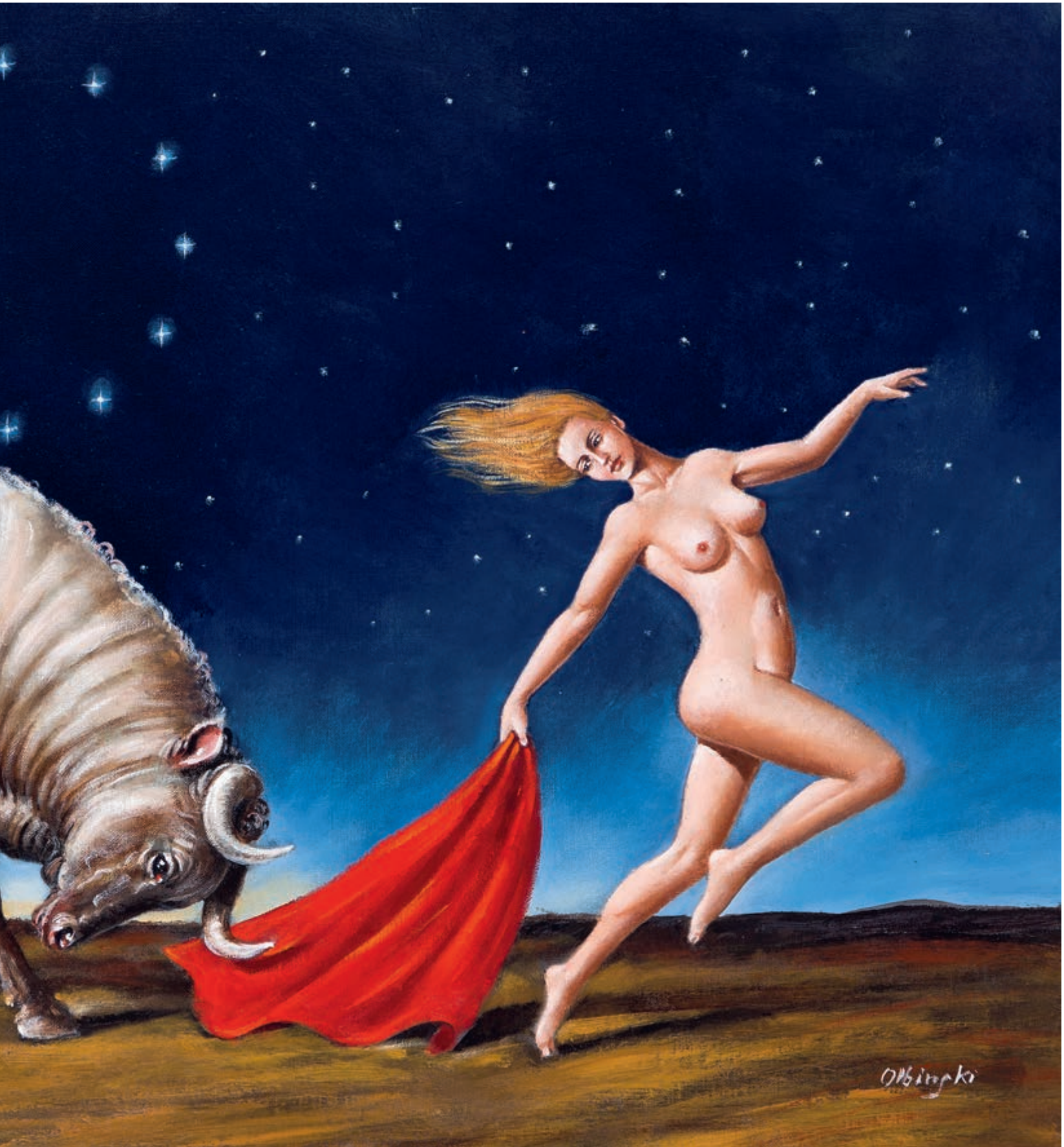
The Rape of Europe 44 × 80 cm 2023