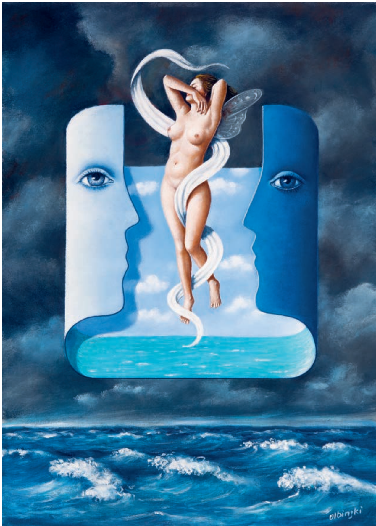
Tempest 60 × 45 cm 2015