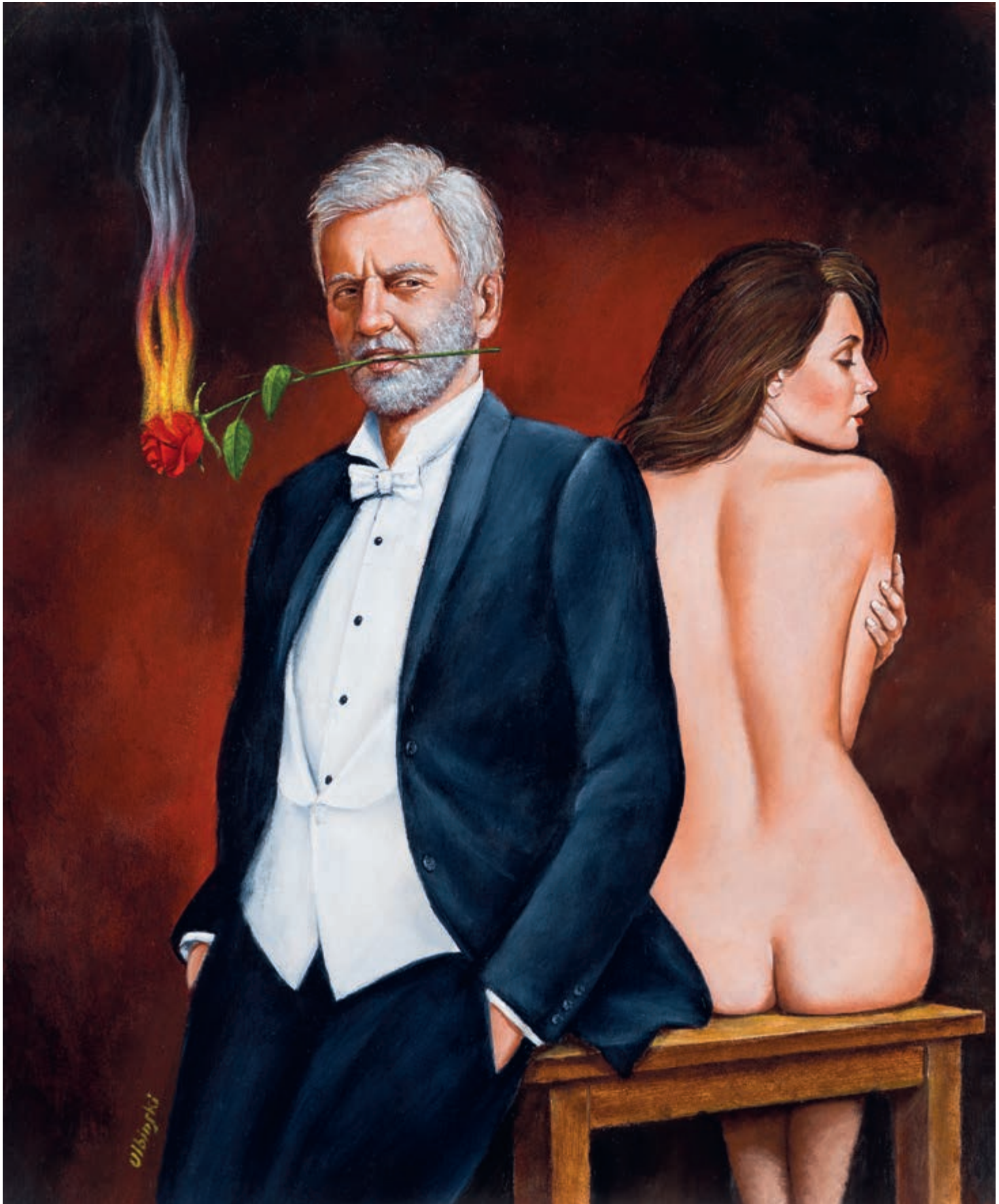
Self-Portrait with a Burning Rose 62 × 51 cm 2023