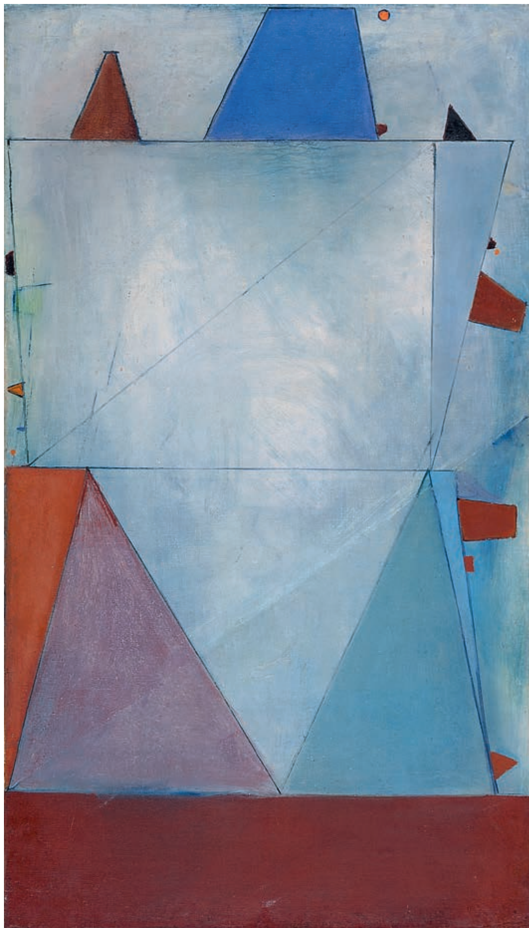
Bitwa o Addis Abebę, 1947, olej na płótnie, 136,7 × 78,4 cm