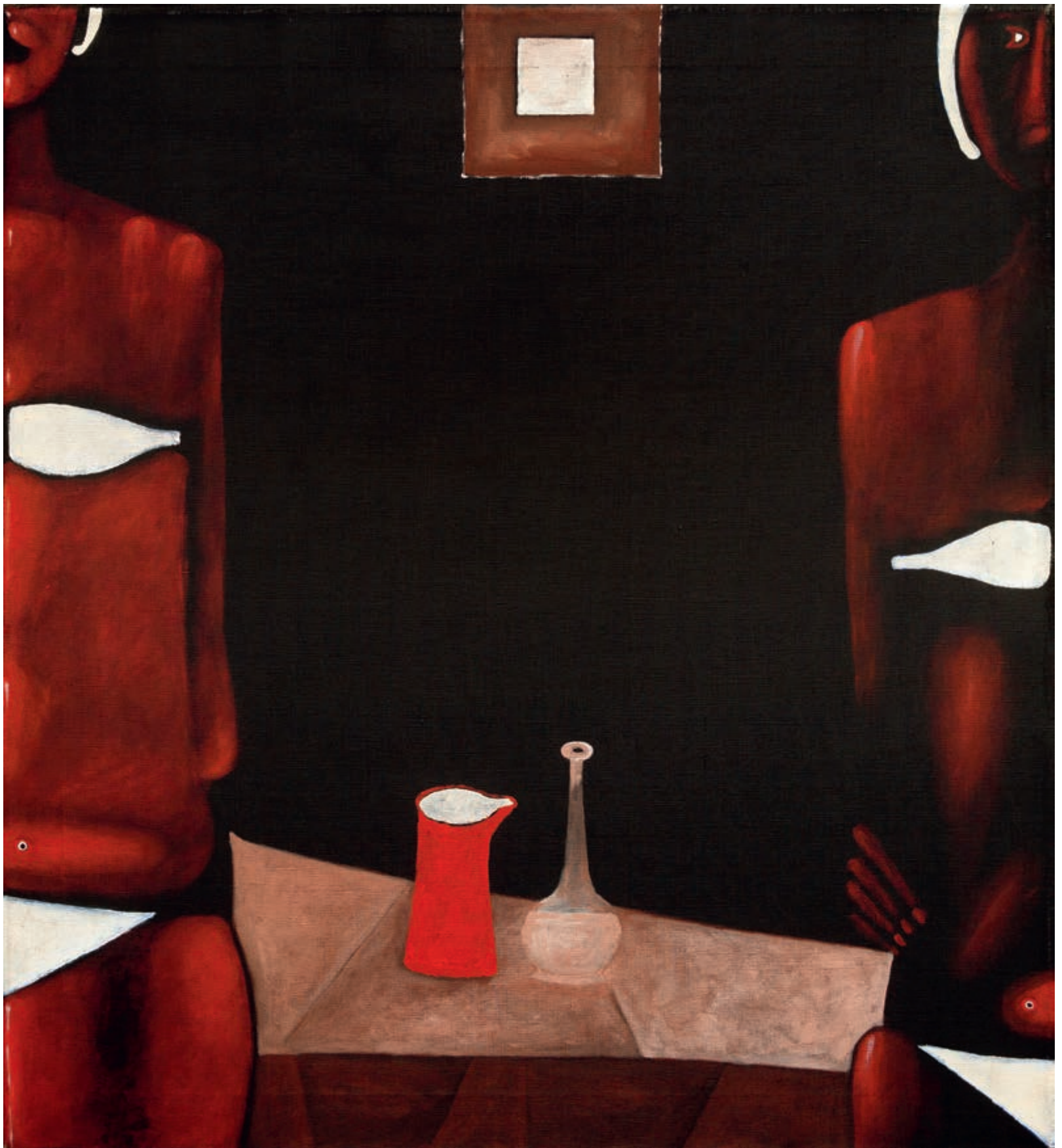
Dwie kobiety w negliżu, 1975, akryl na płótnie, 90 × 80 cm