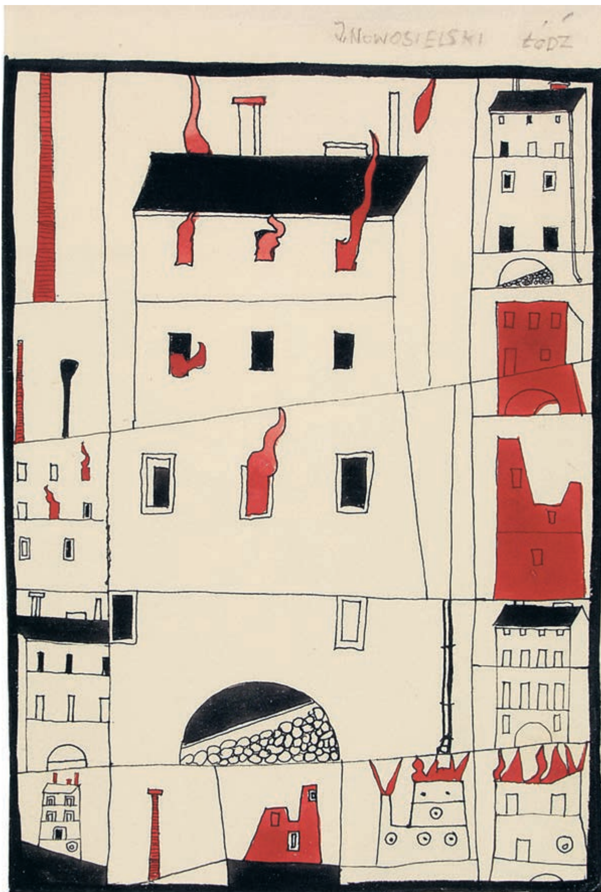
Pożar , [1952], tuszu, akwarela na papierze, 18,5 × 12,4 cm