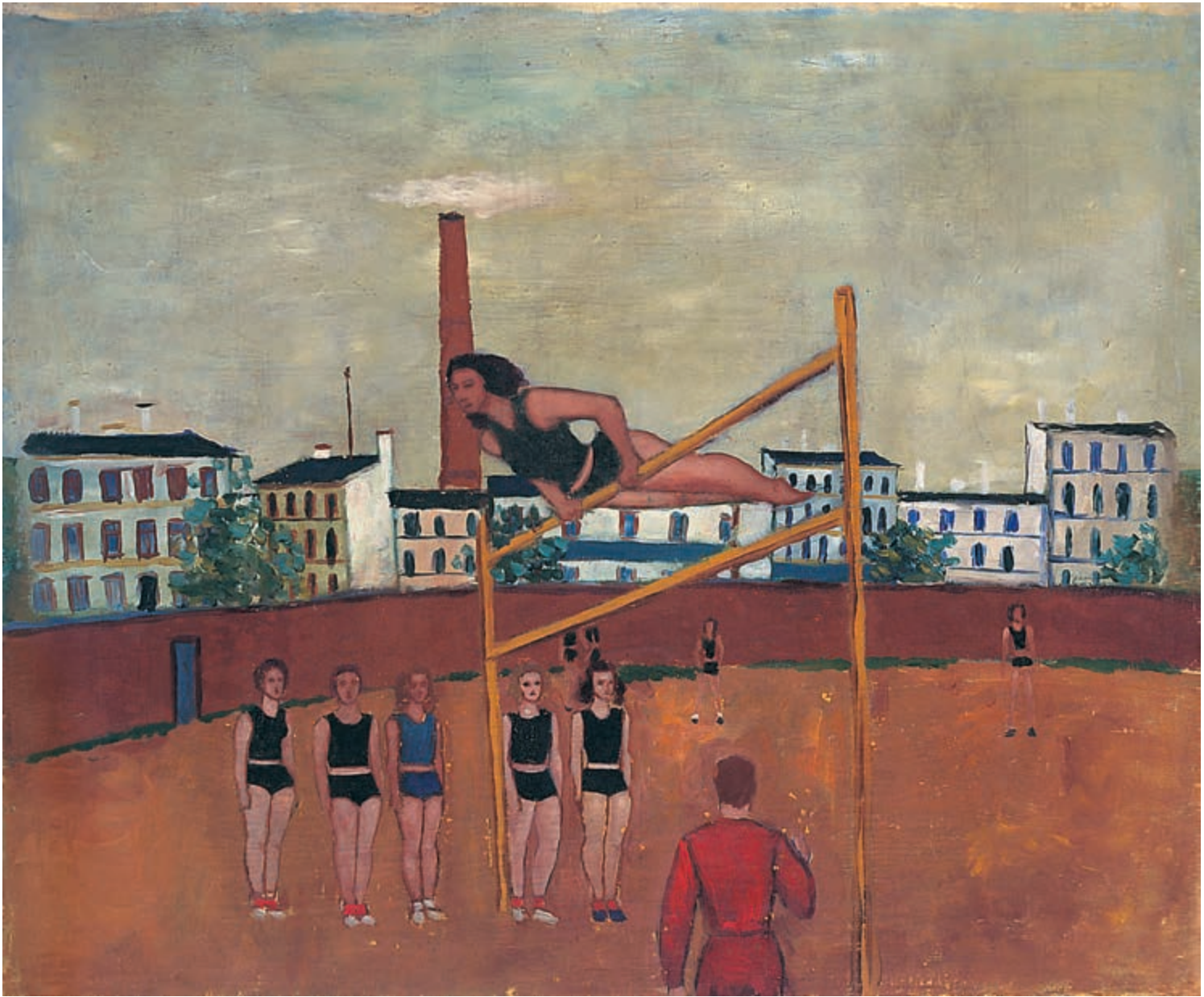
Gimnastyczki , 1952, olej na płótnie, 49,5 × 59,5 cm