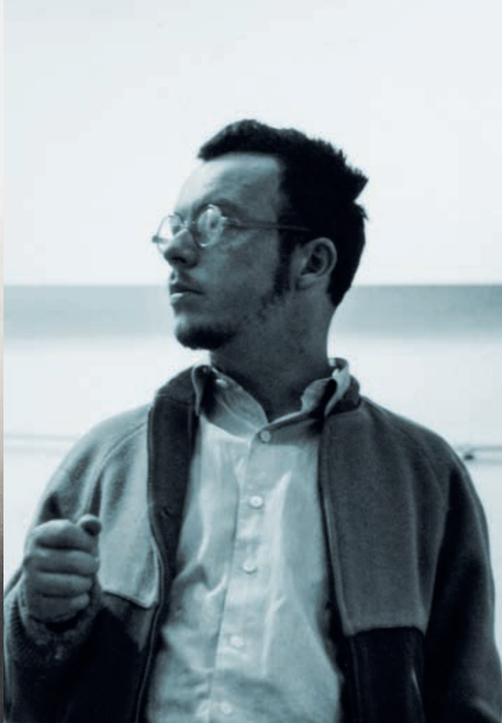
Jerzy Nowosielski w pracowni, Łódź, 1958