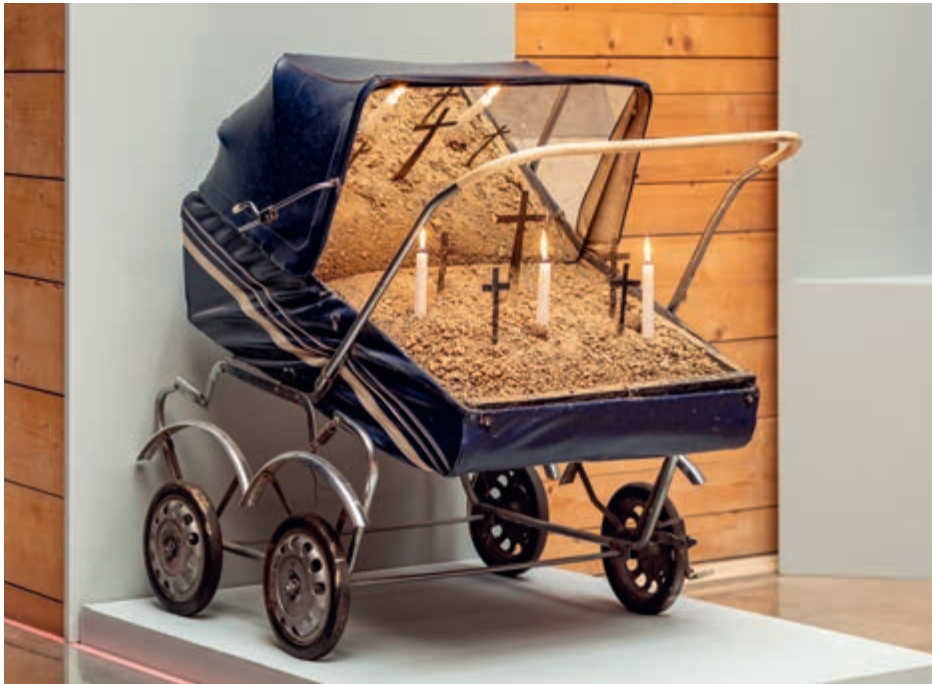
Czarny krajobraz, 1973, assemblaż (wózek dziecięcy, metal, ziemia, lustro, instalacja elektryczna), 100 × 85 × 100 cm, nr inw. S/3395/MT | Black Landscape, 1973, assemblage (pram, metal, earth, mirror, electrical installation), 100 × 85 × 100 cm, inv. no. S/3395/MT