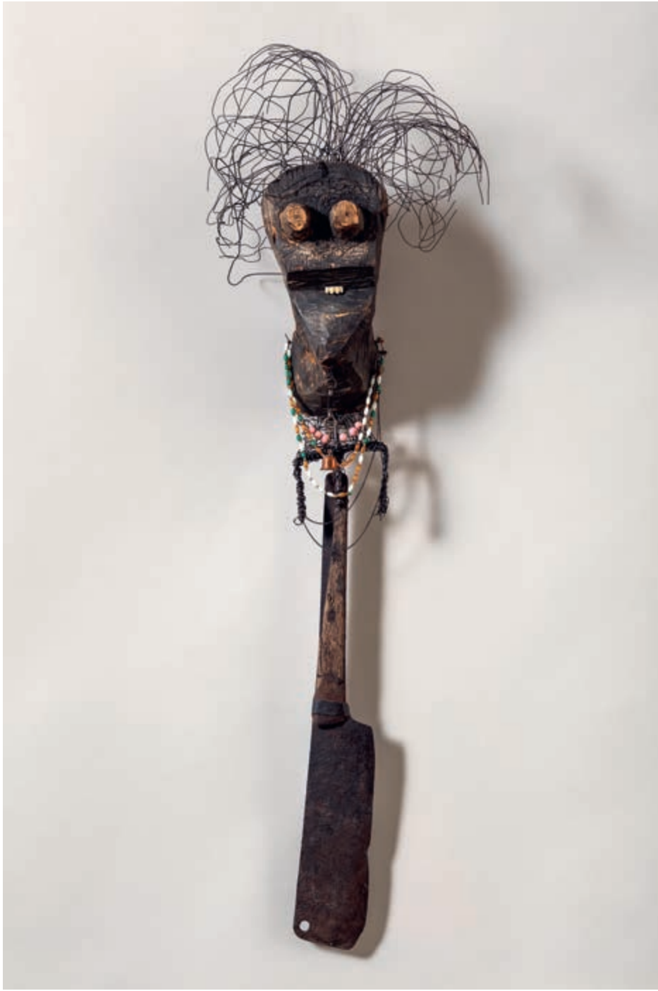
Włodar, 1957, assemblaż (drewno, metal, drut, plastik), 121 x 50 x 35 cm, nr inw. S/3283/MT | Włodar, 1957, assemblage (wood, metal, wire, plastic), 121 x 50 x 35 cm, inv. no. S/3283/MT