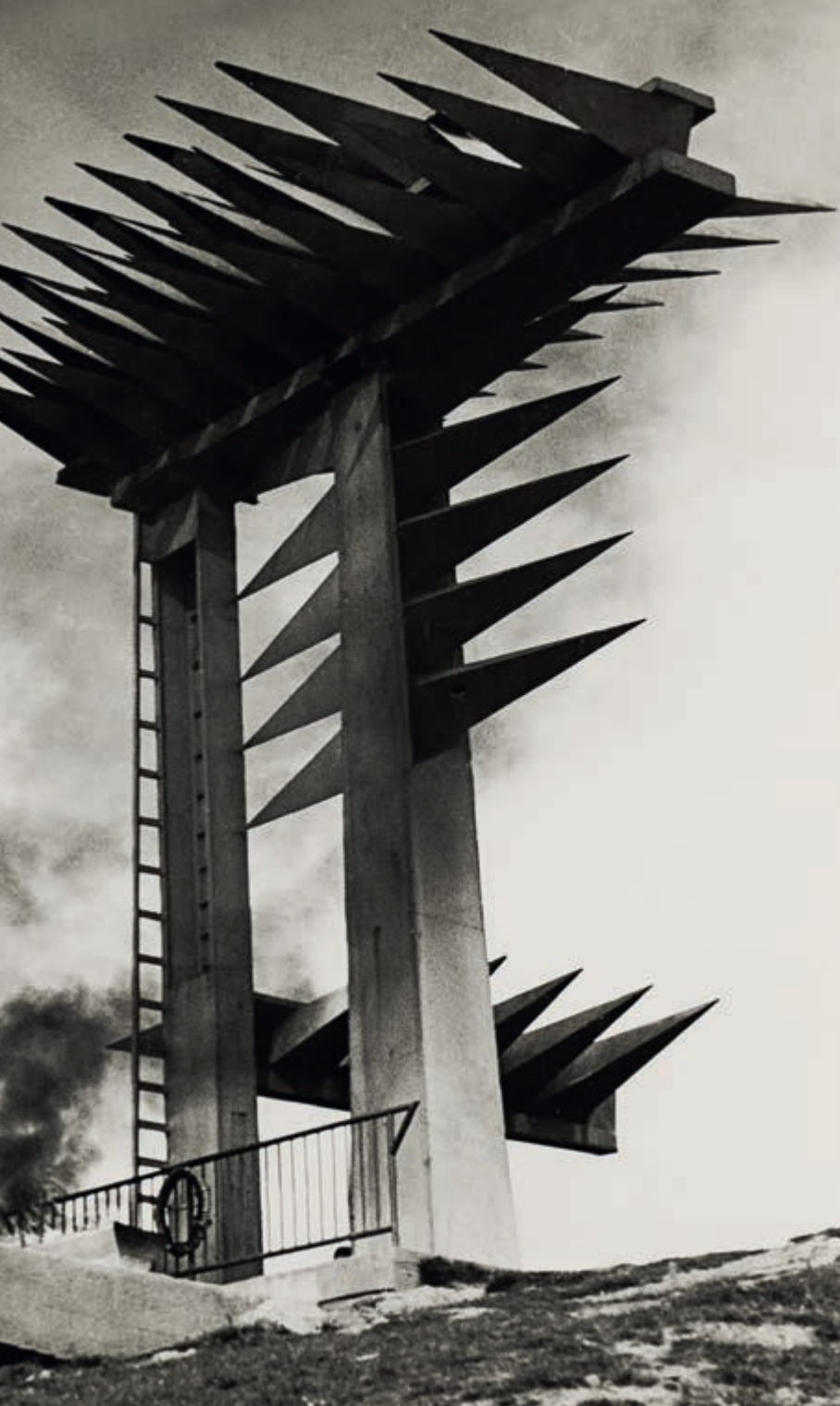
Pomnik Żelazne Organy na przełęczy Snozka, b.d., fotografia, 13 × 18 cm, nr inw. AF/WH/1/4.2.4/19 | Iron Organ Monument on Snozka Pass, n.d., photograph, 13 × 18 cm, inv. no. AF/WH/1/4.2.4/19