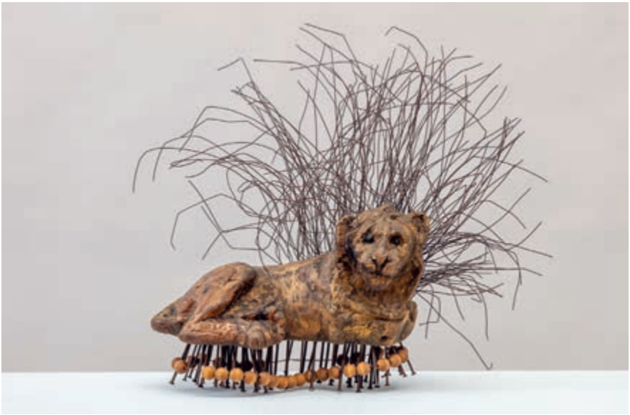
Bez tytułu [ Lew ], koniec lat 50., asamblaż [drewno, drut, metal], 52 × 48,5 × 27 cm, nr inw. S/4545/MT | Untitled [ Lion ], late 1950s, assemblage (wood, wire, metal), 52 × 48.5 × 27 cm, inv. no. S/4545/MT