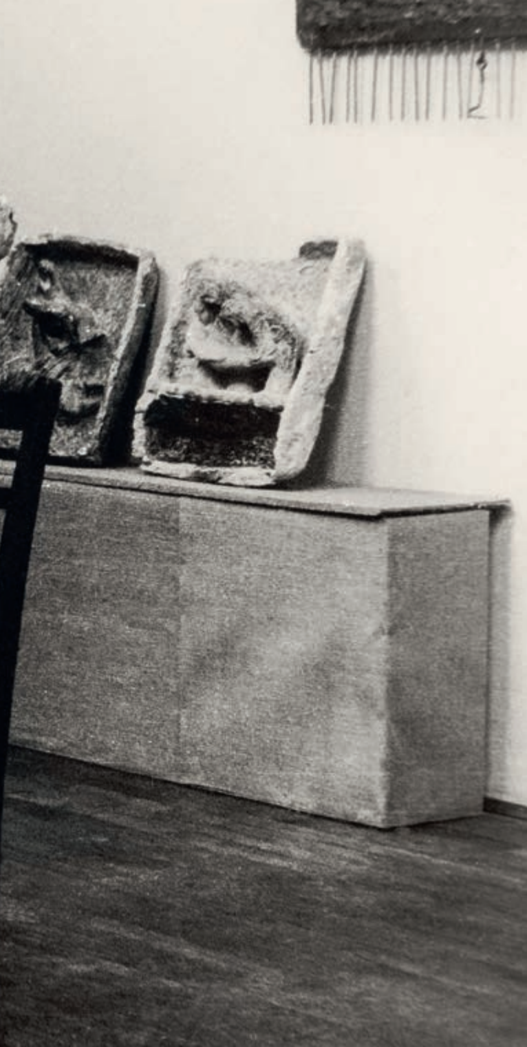
Niobe, b.d., fotografia, 13 x 20 cm, nr. inv. AF/WH/O/4.3.1/86 | Niobe, n.d., photograph, 13 x 20 cm, inv. no. AF/WH/O/4.3.1/86