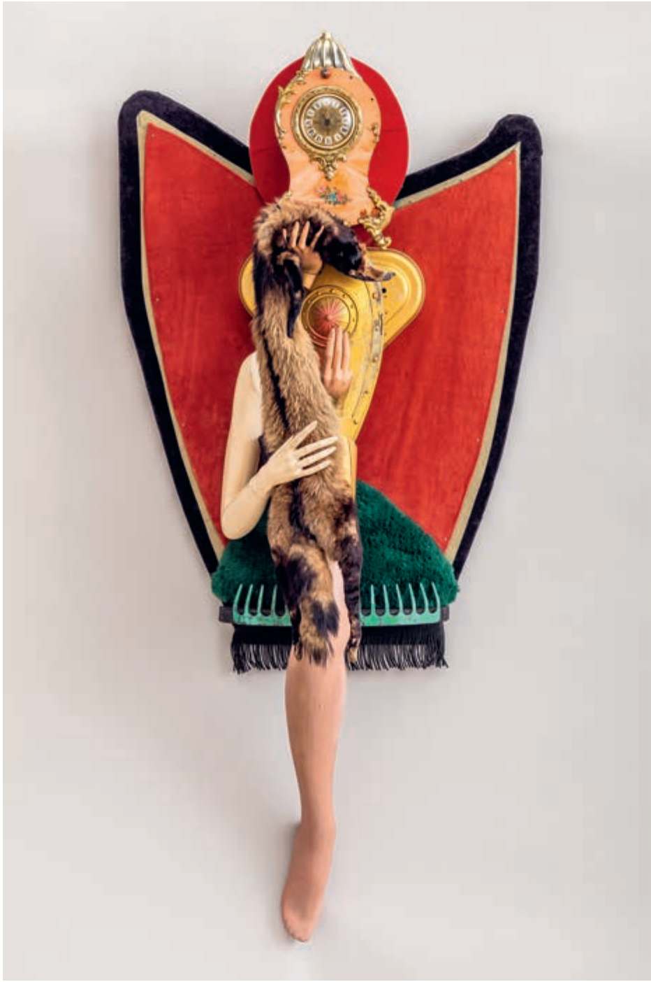
Dama z łasiczką, 1987–1990, assemblaż [plastik, tkanina, metal, futro], 170 × 84 cm, nr inw. S/4292/MT | Lady with Ermine, 1987–1990, assemblage [plastic, fabric, metal, fur], 170 × 84 cm, inv. no. S/4292/MT