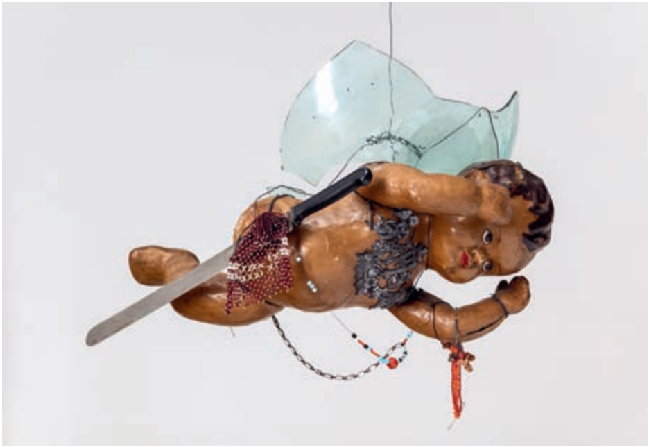
Bez tytułu [ Lecący anioł – wypędzenie z raju (?)], ok. 1975, asamblaż (plastik, metal, szkło), 65 × 65 cm, nr inw. S/4599/MT | Untitled [ Flying Angel – Expulsion from Paradise (?)], circa 1975, assemblage (plastic, metal, glass), 65 × 65 cm, inv. no. S/4599/MT