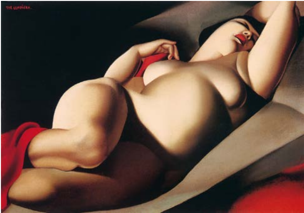
◆ Piękna Rafaëla, 1927, olej na płótnie, 65 × 92 cm

W połowie lat dziewięćdziesiątych Sir Tim Rice, autor tekstów piosenek i twórca najwspanialszych musicali dwudziestego wieku, nie znał