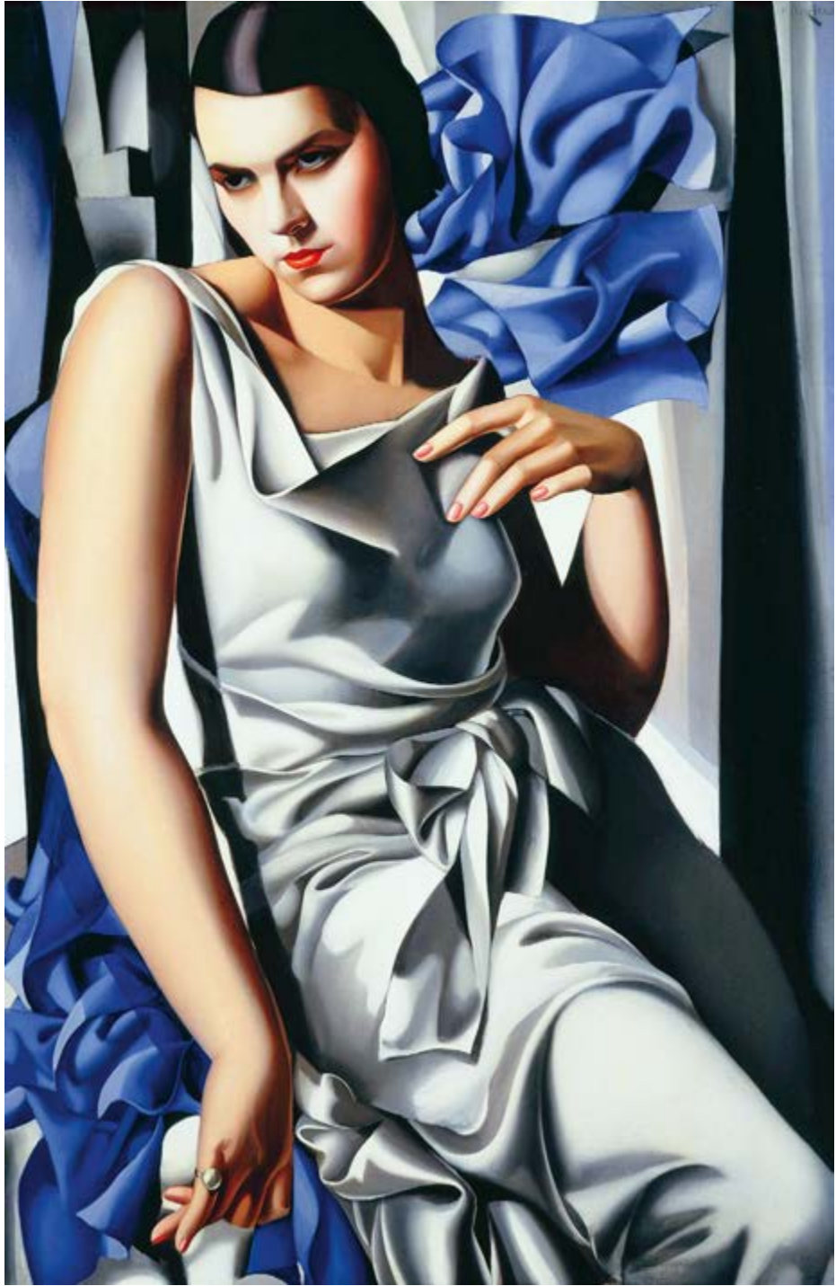
◆ Portret pani M., 1932, olej na płótnie, 100 × 65 cm