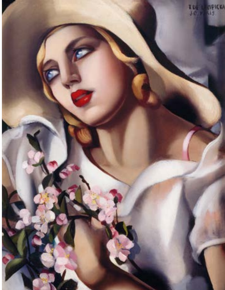
◆ Stonkowy kapelusz , 1930, olej na desce, 35 x 27 cm