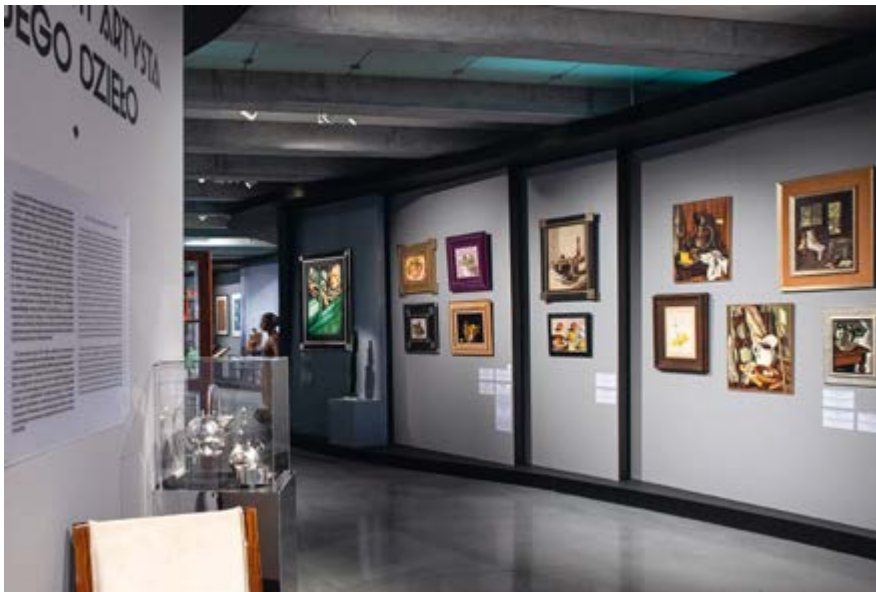
◆ Wystawa w Muzeum Narodowym w Lublinie, 2022

należał więc do Łempickiej. W czasie wszystkich trzech wystaw niemal 300 000 odwiedzających miało okazję zobaczyć 115 jej oryginalnych dzieł, 20 fotografii i przedmioty osobiste, z których wiele ujrzało światło dzienne po raz pierwszy.