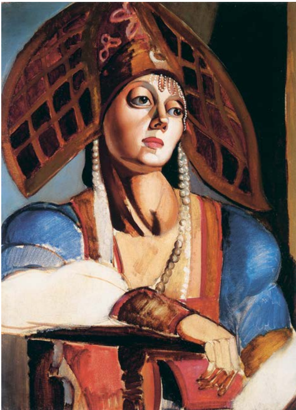
◆ Rosyjska tancerka , ok. 1924, olej na płótnie, 81 × 60 cm