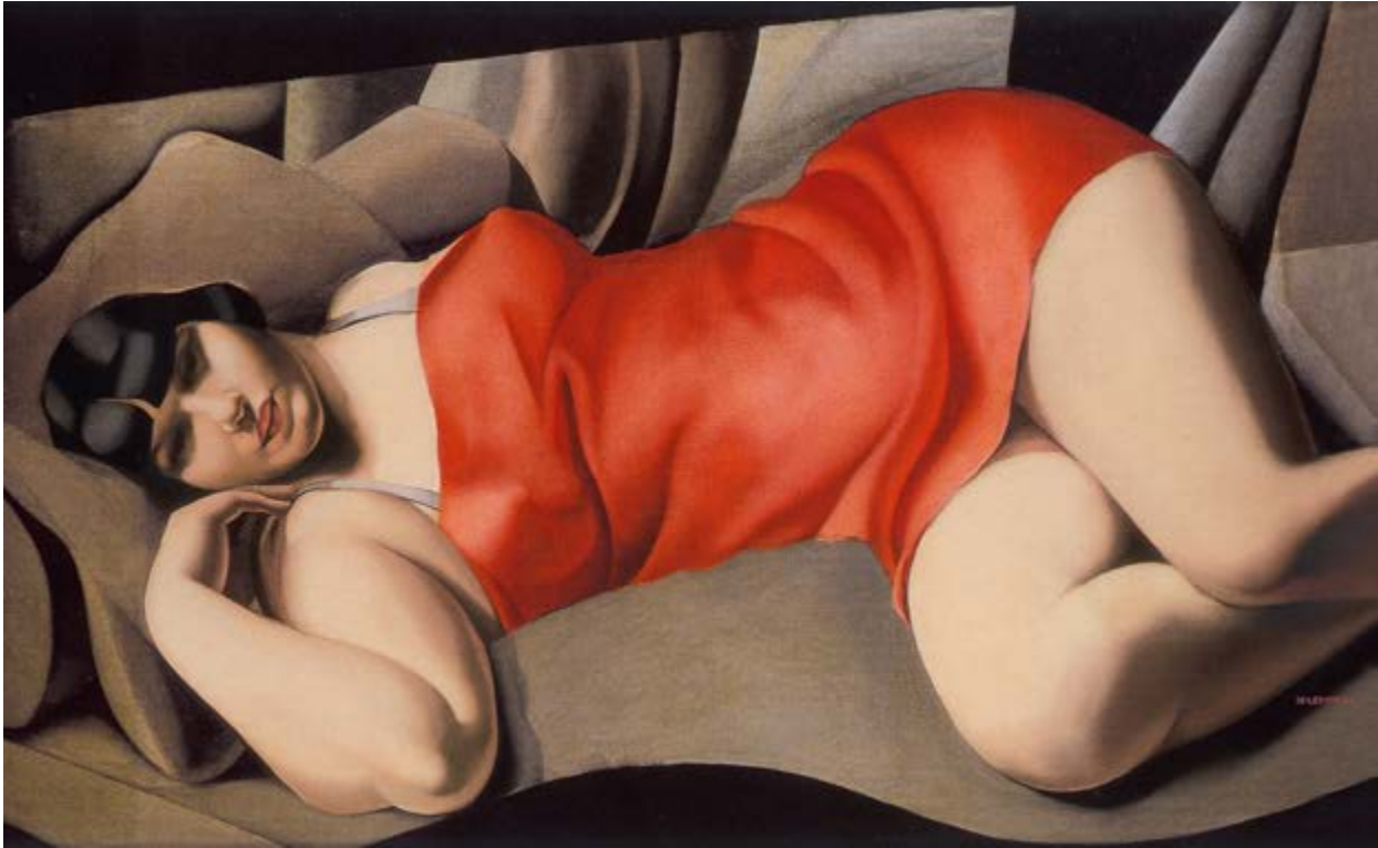
◆ Różowa tunika , 1927, olej na płótnie, 73 × 116 cm