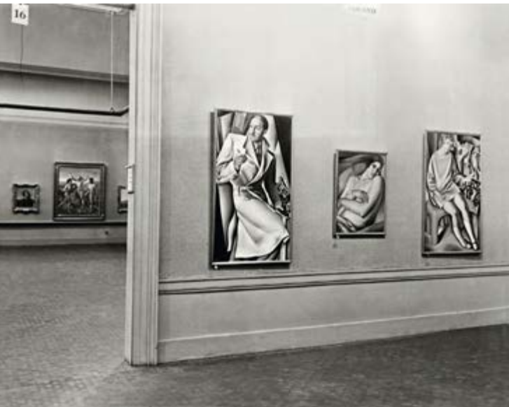
◆ Wystawa w Carnegie Institute, 1929, czarno-biała fotografia

Wkrótce po otwarciu wystawy magazyn „Time” opublikował artykuł, w którym (w ostatnim akapicie) wspomniał z uznaniem o Tamarze: