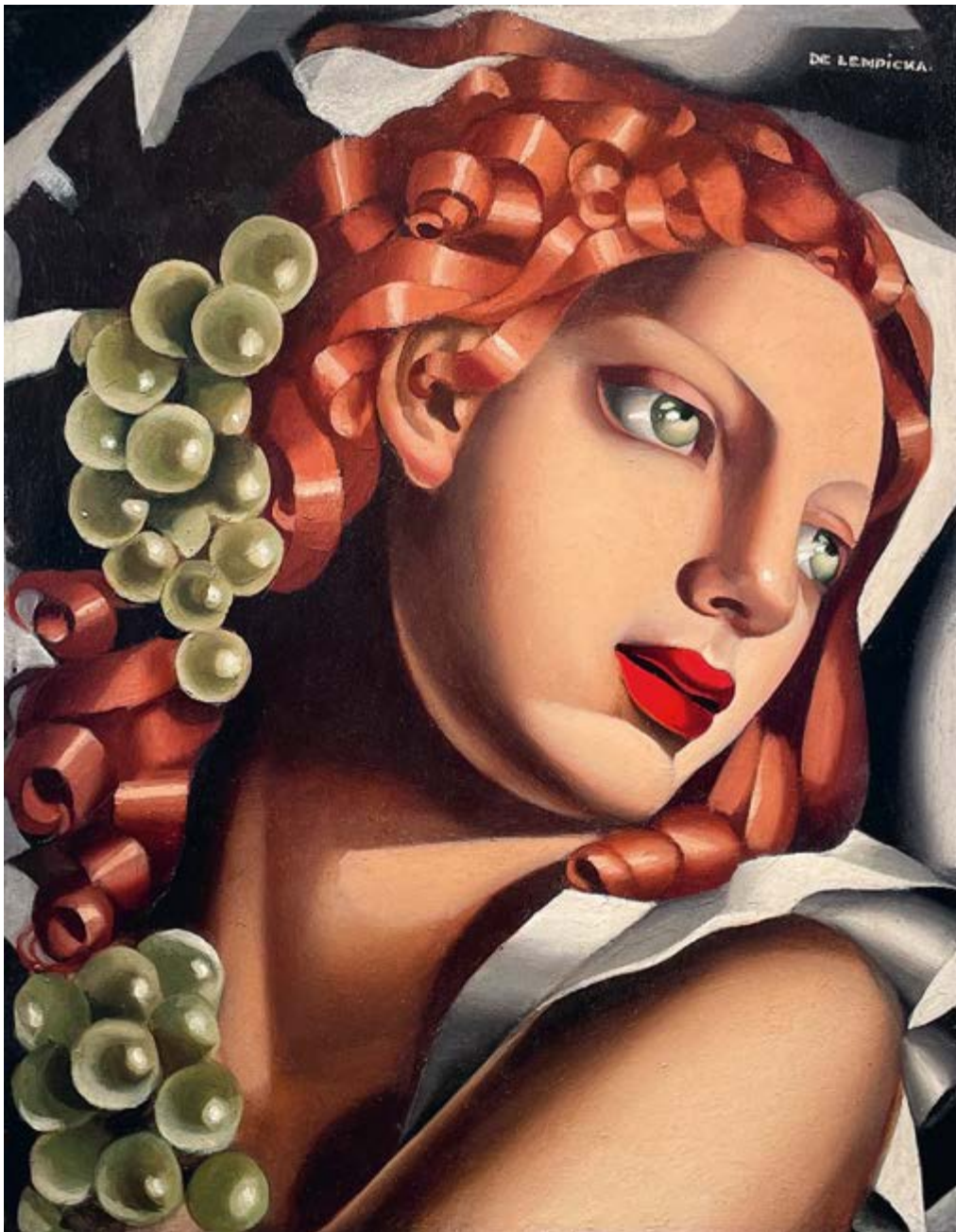
◆ Blask , ok. 1932, olej na desce, 35 × 27 cm