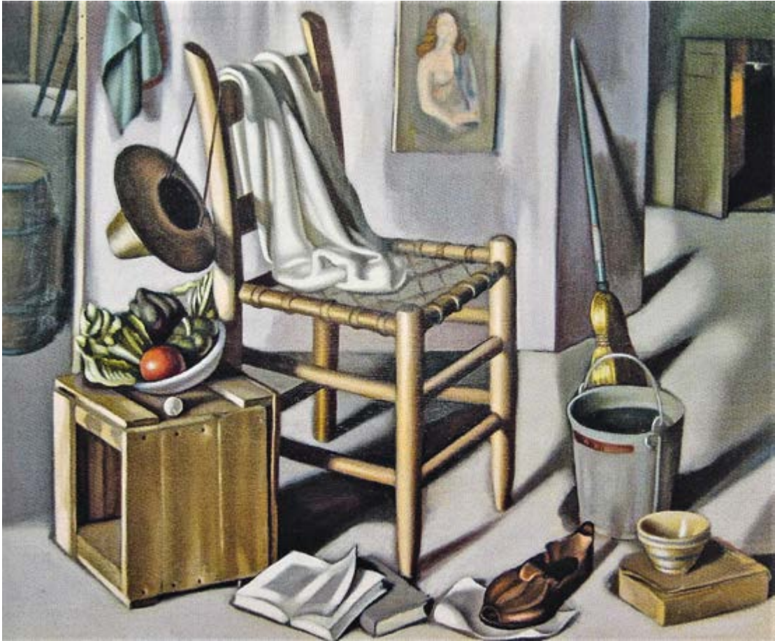
◆ Kompozycja w atelier, 1941, olej na płótnie, 50,8 × 61 cm

W 2011 roku Anjelicę, Jacka Nicholsona oraz wielu innych kolekcjonerów i muzea poproszono o użyczenie obrazów na wystawę Tamara de Lempicka – Regina del Moderno w Complesso del Vittoriano w Rzymie. Przygotowania do wydarzenia trwały od lat i była to jak dotychczas największa wystawa indywidualna artystki prezentująca ponad 150 prac jednocześnie. Wówczas obydwie obrazy pokazano publicznie po raz pierwszy i ostatni. Wkrótce potem, w 2012 roku, Huston sprzedała je w Sotheby's w Londynie, zyskując znacznie więcej, niż zapłacił za nie Jack Nicholson dwadzieścia siedem lat wcześniej. Anjelica może nie jest już ich właścicielką, posiada za to ukochaną parę kolczyków, które należały kiedyś do Tamary.