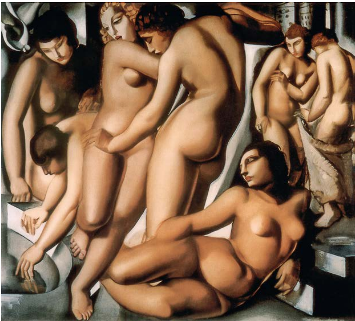
◆ Kobiety w kąpieli , 1929, olej na płótnie, 89 × 99 cm