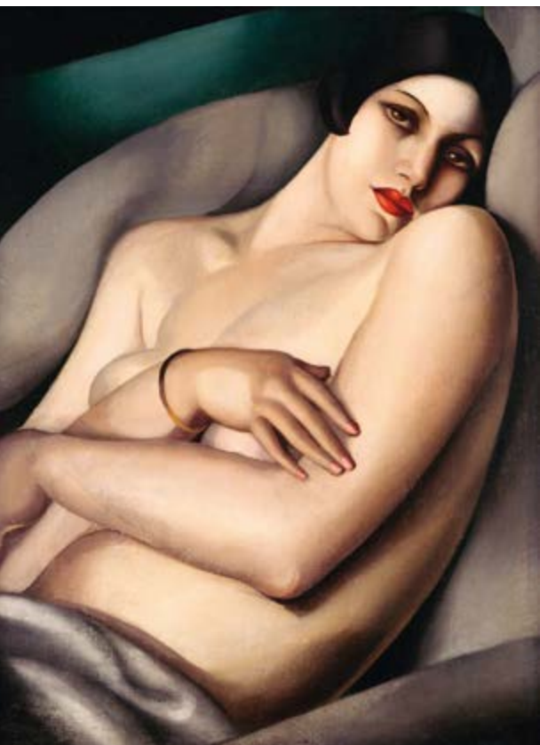
◆ Marzenie , 1927, olej na płótnie, 81 × 60 cm