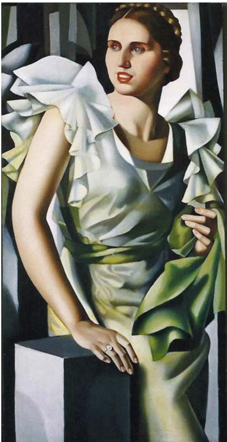
◆ Portret młodej kobiety przy kwadratowej kolumnie, ok. 1931, olej na płótnie, 100 × 51 cm