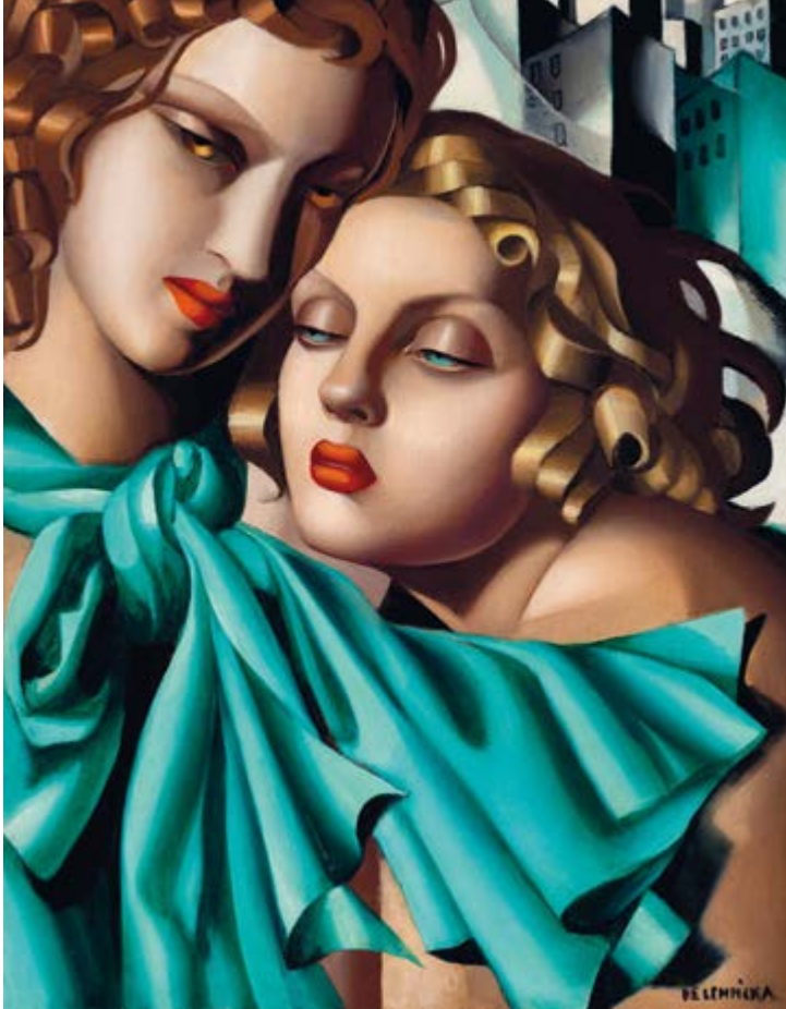
◆ Dziewczęta, ok. 1930, olej na desce, 35 × 27 cm