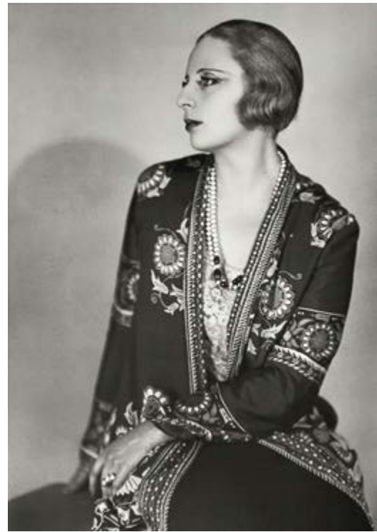
◆ Tamara Łempicka w obiektywie Studia Lorelle, 1928, czarno-biała fotografia