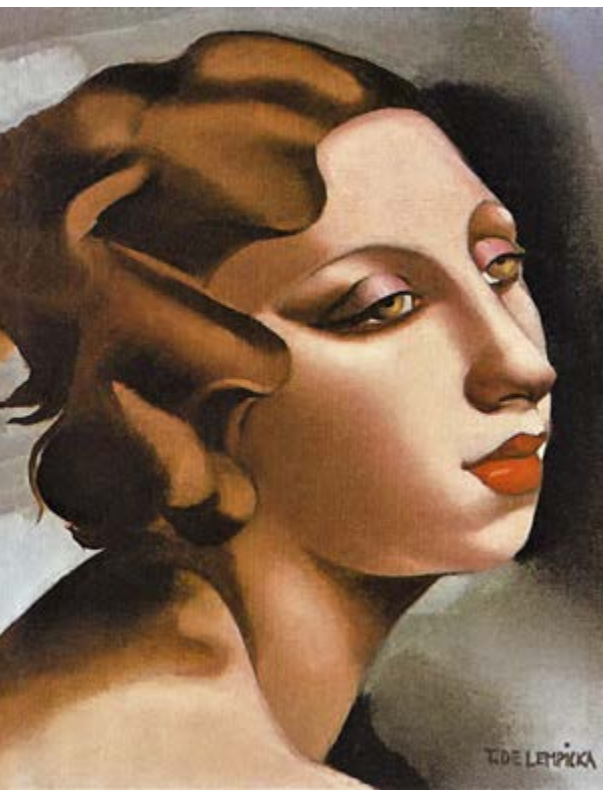
◆ Portret młodej kobiety , ok. 1928, olej na płótnie, 27 × 22 cm

Późniejsza interpretacja Tamary przedstawia aż siedem modelek. Żadnej z nich nie udało się rozpoznać z wyjątkiem jednej w prawym dolnym rogu na pierwszym planie. Widzimy ją również na wcześniejszym Portrecie młodej damy (1928). Jej wyrazisty profil i nagie ramiona sugerują, że jest to studium do jednej z postaci na obrazie Rytm . W tym czasie Łempicka dużo malowała i można przypuszczać, że inne zlecenia lub inspiracje często odrywały ją od pracy nad obrazem. Wyjaśniałoby to, dlaczego ogromna scena pozostała częściowo niedokończona i niepodpisana. Zarówno studium, jak i gotowe dzieło pozostały niesprzedane i nie wystawiano ich za życia Tamary, a pieczęć autentyczności zyskały dopiero po jej śmierci.